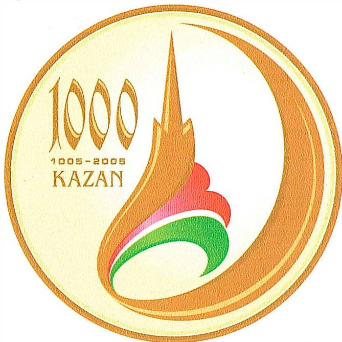
Эмблема-символ празднования 1000-летия Казани.