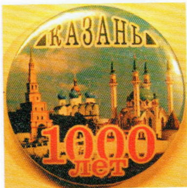
Некоторые значки, выпущенные к 1000-летию Казани. Фрагмент коллекции Г. Бушканца