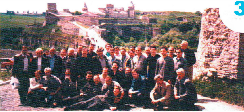
Участники Слета на экскурсии в средневековой крепости, г. Каменец-Подольский, 2 июня 2001 г.