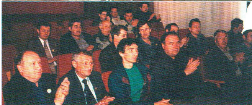
Пленарное заседание Слета, г. Хмельницкий, 2 июня 2001 г.