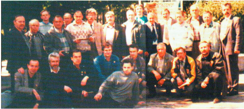
Участники Слета в Хмельницком клубе коллекционеров, ул. Проскуровская, парк им. И. Франко, 3 июня 2001 г.