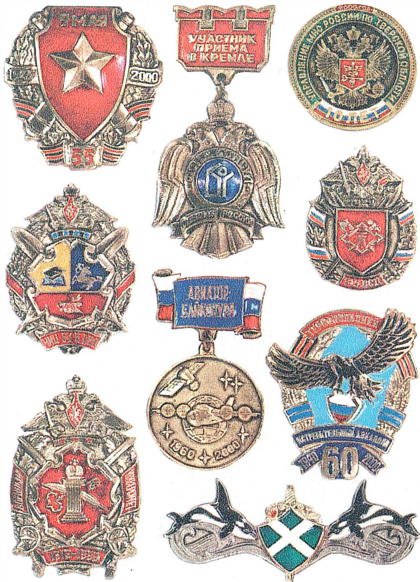
Образцы значков с военной тематикой, изготовленные Союзом геральдистов России.