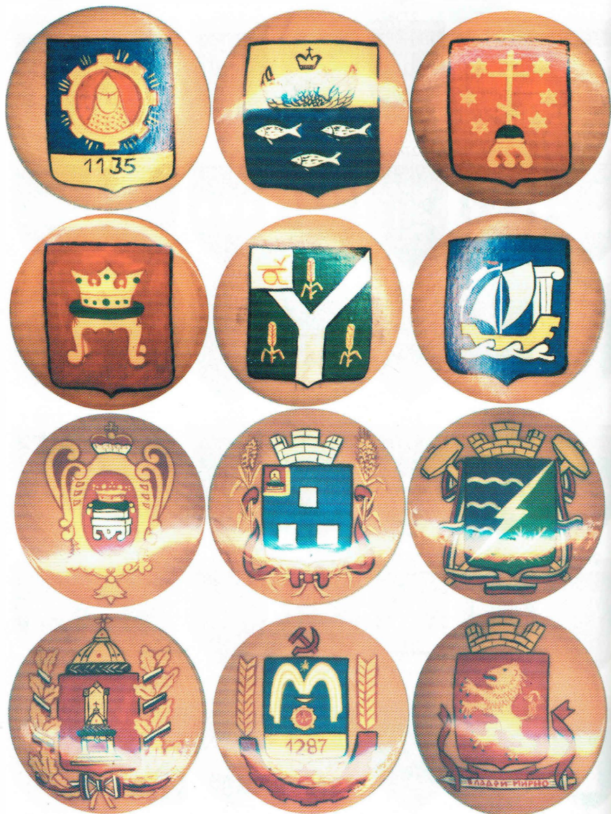
Образцы значков серий "Гербы Тверской земли".