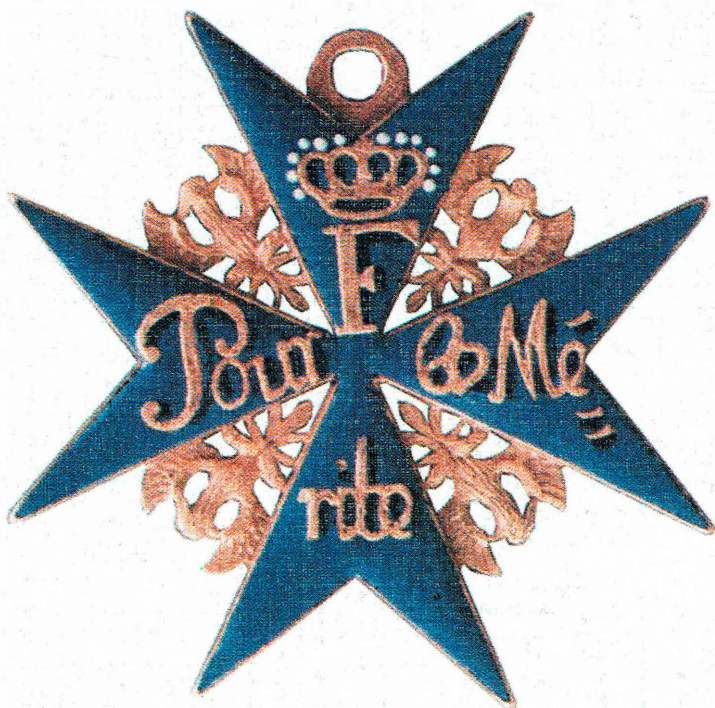
Прусский Королевский орден «POUR LE MÉRITE» [«ПУР ЛЕ МЕРИТ»]