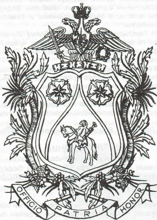
Проект герба Отдела военной геральдики и символики Военно-исторического центра ВС РФ.