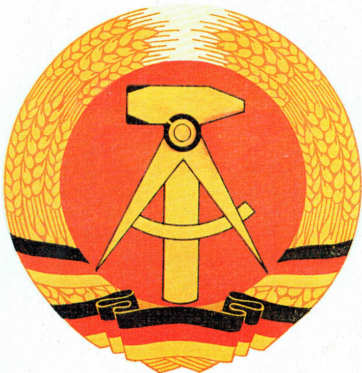
Государственный герб Германской Демократической Республики