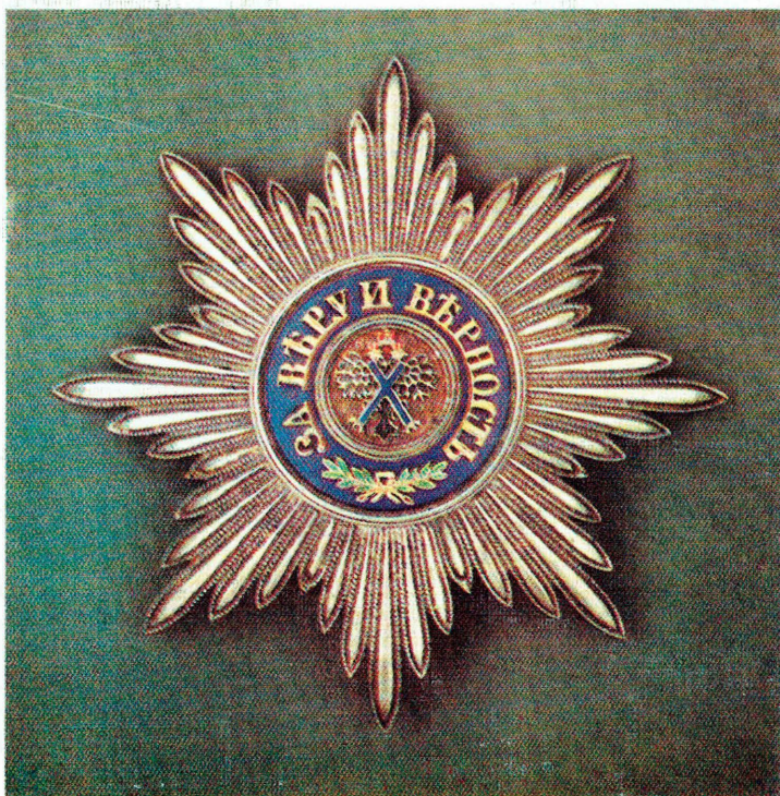
Звезда ордена Святого апостола Андрея Первозванного.