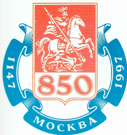
Автор С.М. Шведов