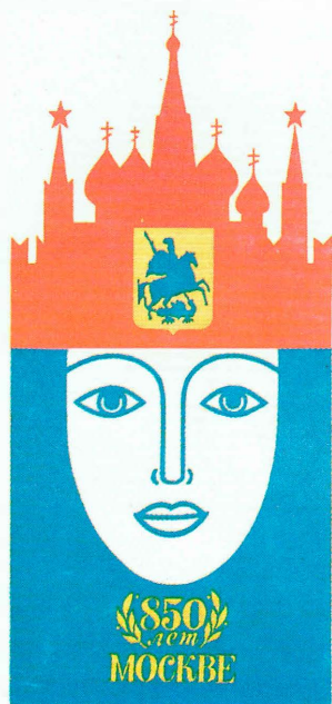
Авторы М.В. Лукьянов, Е.С. Цвик

Знаки атрибутики празднования 850-летия основания Москвы