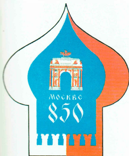
Автор Г.С. Ушаев