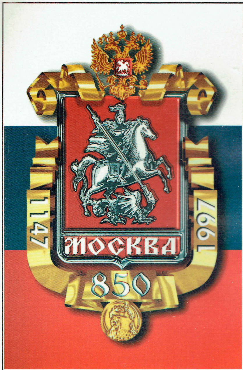
Официальная эмблема-символ праздника 850-летия основания Москвы (сувенирное исполнение на пластике)