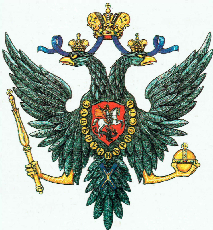
Государственный герб России. 2-я половина XVIII в.