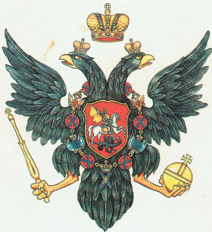
Государственный герб России. 30 - 60-е гг. XVIII в.