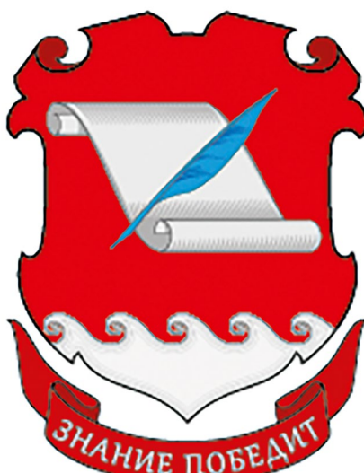
Герб Ильинской школы.