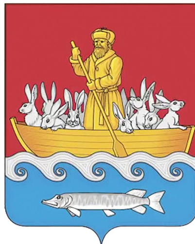
Герб Шунгенского сельского поселения.

его историю, природу, традиции и обычаи. На протяжении более десяти лет, начиная с конца 50-х годов XIX века, Н.А. Некрасов неоднократно в летние месяцы приезжал в Костромскую губернию на охоту.