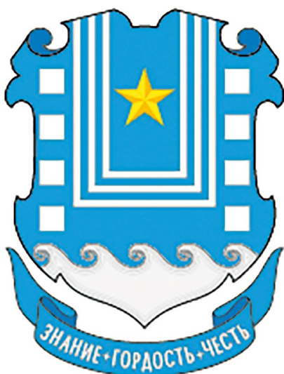
Герб Минской школы.