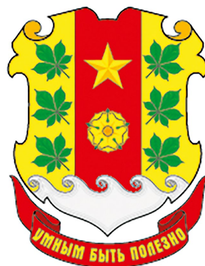
Герб Шунгенской школы.