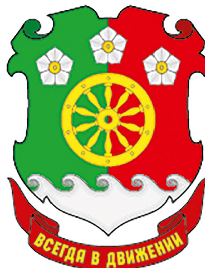
Герб Зарубинской школы.