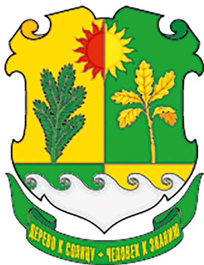
Герб Сущёвской школы.