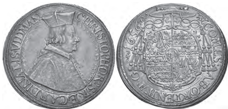
Рис. 2. Талер. 1656 г. Лицевая и оборотная стороны. На аверсе монеты – портрет кардинала X. Видмана, на реверсе – его кардинальский герб ( Kreisel H. Prunkwagen und Schlitten. – Leipzig, 1927. – P. 139 ).

владельческого знака с карнавальными саней из собрания Государственного исторического музея 7 (рис. 2). Вероятно, экипажный мастер, перенося изображение герба на кузов, не совсем добросовестно исполнил свою работу.