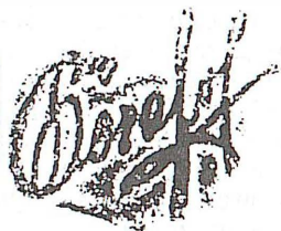
Образцы штампов и печатей Проскуровской фабрики, хранящихся в Хмельницком областном краеведческом музее.