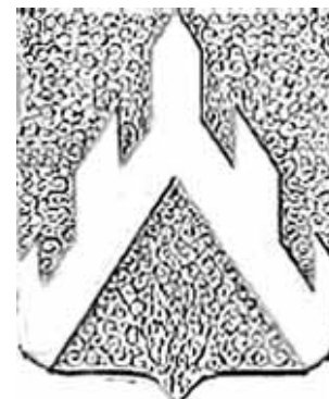
Рис. 8. Герб (гербовый щит) рода баронов Буксгевден (ОГ 15-8).

Например, герб рода графа Павла Коцебу 11 (рис. 7, 7а-б), где дамасцировка не указана в описании. Зато она есть на рисунке, где выполняет чисто декоративную функцию. Более того, попытка И.В. Борисова включить дамасцировку в описание герба привела к его искажению. В блазоне, составленном Игорем Владимировичем для своей книги, в щите внезапно появляется «внешняя кайма» в дамасцированном серебряном поле. Хотя самоочевидно, что нет этого элемента в гербе, это просто художественный прием, показывающий выпуклость щита по краю. Что подтверждается и