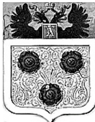
Рис. 7. Герб (гербовый щит) графа П. Коцебу (ОГ 13–10).

Даже в самом Общем гербовнике есть как гербы с фиксированной в описании дамасцировкой, так и с не фиксированной. Где дамасцировка служит на рисунке герба просто декоративным целям.