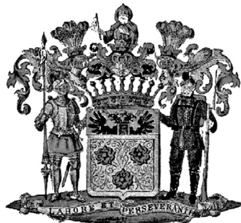
Рис. 7б. Герб (полный) графа П. Коцебу, с дамасцировкой, в «Балтийском гербовнике» К.А. фон Клингспора.