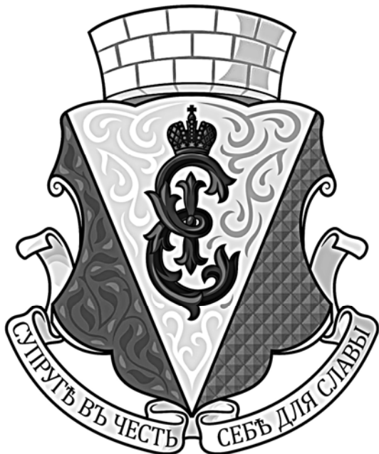
Рис. 5. Дамасцировка 6 в гербе Екатерингофского мун. округа.