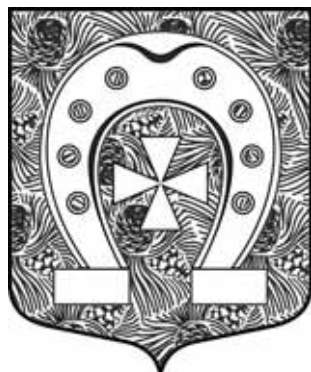
Рис. 2. Герб Красносельского сельского поселения Ленинградской обл.: «в зеленом поле, дамасцированном золотом наподобие сосновых шишек и игл».

В одних случаях она используется, как своеобразная хитрость, чтобы описать архитектурные формы, через геральдические фигуры. В других случаях, это способ не описывать подробно на-