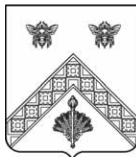
Рис. 3. Герб Лобойковского с.п. Волгоградской обл.: «серебряное стропило, дамасцированное».

родные орнаменты, как в гербе Лобойково 2 (рис. 3). В третьих случаях, это просто излишняя информация, т.к. необязательно описывать рог как дамасцированный, чтобы изобразить на нем некий рисунок, как на гербе поселка Войковицы 3 . Или на гербе Апанасенковского района, где и без указания дамасцировки в описании понятно, что на золотом руне есть шерсть 4 . В четвертых случаях, дамасцировку можно было бы описать иными терминами. В гербе Таттинского наслега вообще в зеленом поле зеленое кольцо, дамасцированное золотом 5 (рис. 4).