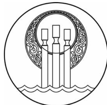
Рис. 4. Герб Таттинского наслега: «безант, окруженный разомкнутым дамасцированным золотом зеленым кольцом».

При этом слово «дамасцированное» совершенно не дает представление о том, что изображено на гербе. По одному лишь описанию, не глядя на рисунок, невозможно точно воспроизвести этот