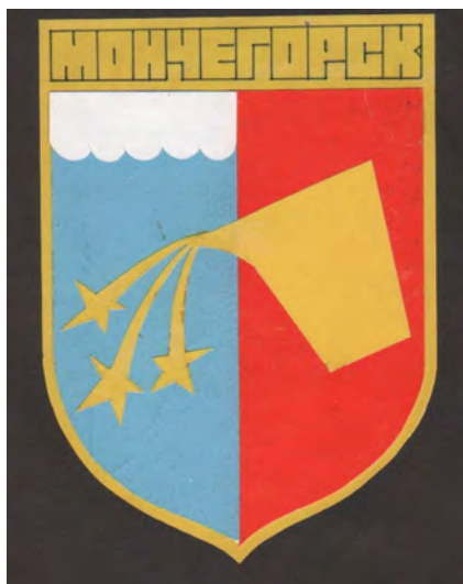
Проект герба Игоря Недорезова