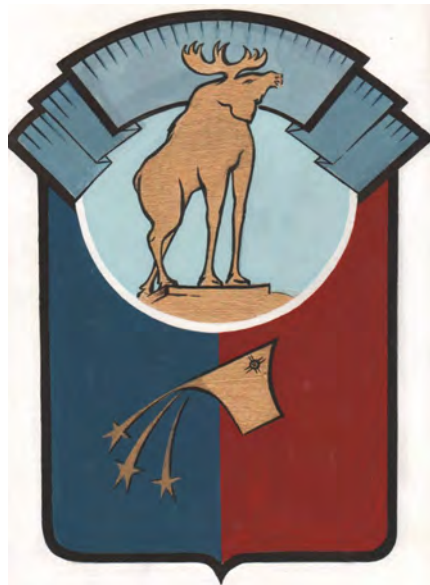
Окончательный герб Мончегорска 1995 года