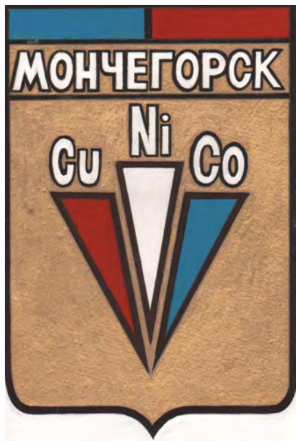
Герб Мончегорска 1987 года