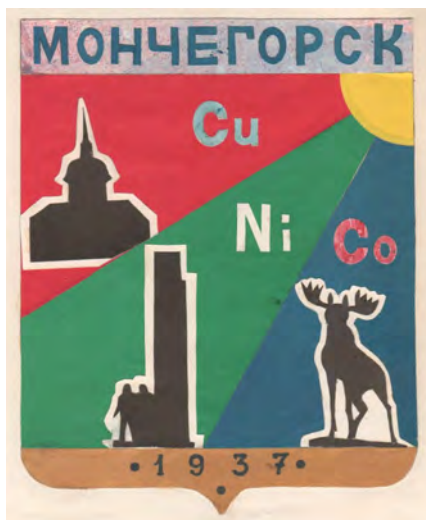
Изначальный проект герба Софьи Шахновской 1995 года