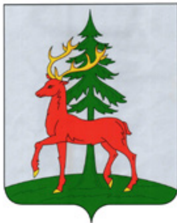
Ил. 2. Герб Ельца

для историков. Рисунок этого герба мы можем увидеть на карте Астраханской и Воронежской губерний 14 и на гравюре «Российская Империя в аллегорическом представлении Фейерверка, зажженного пред Зимним Ее Императорского Величества домом, в Новой 1761 год» 15 . Причем гербы «Фейерверка» связаны с книгой Чеботарева или имеют один и тот же источник. На гравюре изображен герб с двумя елями, одна под другой, что нелогично. Располагать два высоких вертикальных предмета один над другим в практике создания гербов не принято: это некрасиво и неудобно. Можно поместить их рядом или просто нарисовать одну ель. Поэтому подобный герб мог появиться в результате какой-то ошибки. Это первая предпосылка.