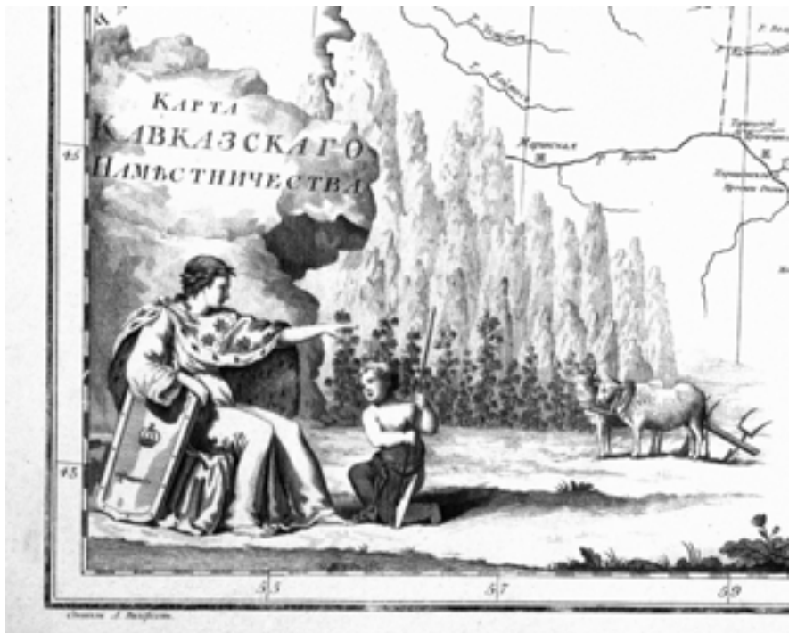
Ил. 3. Карта Кавказского наместничества из атласа 1792 года. Воспроизведено из: Российский атлас, из сорока четырех карт состоящий и на сорок два наместничества империю разделяющий. СПб., 1792. Л. 43

из негласного правила, что герб губернского города должен совпадать с гербом губернии, в качестве герба Петрозаводска стал использоваться олонецкий герб. Вместе с тем встречаются такие свидетельства: «... городу Олонцу предоставлен прежний герб Петрозаводска то есть: пять полос на разделенном зеленою краскою и золотом поле, и три железные молота, пересеченные рудоискательною лозою. Герб города Высочайше утвержден в 1781 году, августа 16-го дня» 21 . Таким образом, Олонец и Петрозаводск поменялись гербами; это не было зафиксировано законодательно, но подтверждается множеством визуальных и текстовых источников 22 .