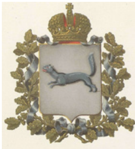
Ил. 7. Герб Уфимской губернии.