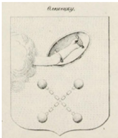
Ил. 4. Герб Петрозаводска. Российский государственный исторический архив. Ф. 1329. Оп. 1. Д. 147. Л. 92