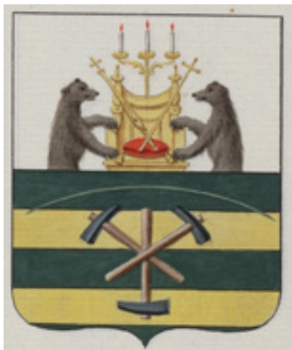
Ил. 5. Герб Олонца. Воспроизведено из: Полное собрание законов Российской империи. Собрание 1. Рисунки гербам городов. СПб., 1843. Л.52