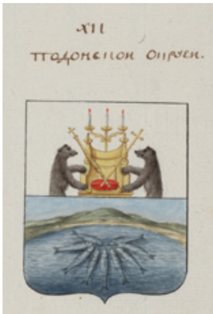
Ил. 9. Герб Паданской округи. Российский государственный исторический архив. Ф. 1329. Оп. 1. Д. 147. Л. 100

Обмен гербами, присваивание себе чужого герба или создание на его основе своего – случаи редкие, но далеко не исключительные в российской земельной геральдике и происходили в разные периоды. Поэтому вероятность заимствования герба стоит учитывать в будущих исследованиях. Можно проследить определенные закономерности. Так как полковая символика является одним из источников российской городской геральдики, некоторые случаи использования чужих гербов можно объяснить историей того или иного полка. Другим источником заимствования гербов были административно-территориальные изменения. Они показывают, что гербы в России были привязаны не к имени, а к территории. Допущение заимствования гербов помогло разрешить загадки происхождения азовского, воронежского и костромского гербов, понять символику герба Приморской области. Вместе с тем идеи, высказанные в статье, встречают непонимание и сопротивление многих краеведов. Трудно принять факт, что герб твоего любимого города не уникальное произведение искусства с почетными элементами, отражающее местные особенности, а заимствование чужого герба, иногда случайное, не несущее сакральных смыслов. Однако заимствование не делает его хуже.