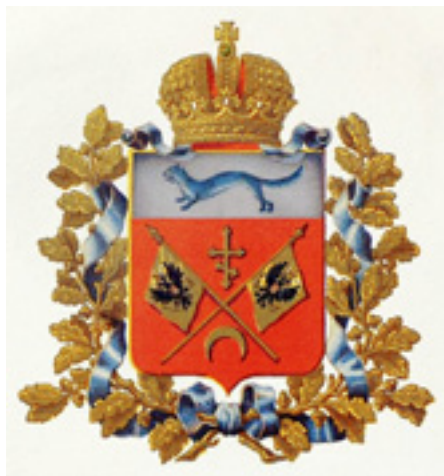
Ил. 6. Герб Оренбургской губернии.