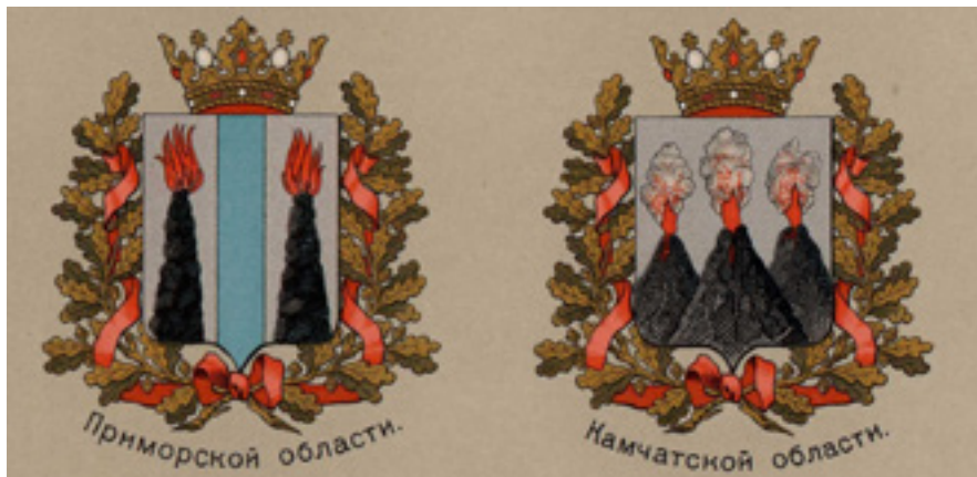
Ил. 8. Гербы Приморской и Камчатской области.

русское знамя и греко-российский крест над полумесяцем, оставляя же во главе щита старый оренбургский герб, т. е. куницу» 30 . В окончательном варианте знамен стало два: «В червленом щите два накрест положенные золотые знамени украшенные императорским российским орлом, сопровождаются сверху золотым греко-российским крестом, а снизу таковым же опрокинутым полумесяцем. В серебряной главе щита лазуревая куница». Герб был утвержден 12 октября 1867 года 31 . Когда из Оренбургской губернии была выделена Уфимская, оставшийся бесхозным старый герб был утвержден в качестве герба последней 5 июля 1878 года: «В серебряном щите, лазуревая бегущая куница, с червлеными глазами и языком. Щит увенчан Императорской короной и окружен золотыми дубовыми листьями, соединенными Андреевской лентой» 32 .