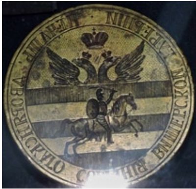
Печать дворянского собрания Виленской губернии.