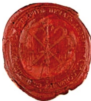
Печать Санкт-Петербургского губернского дворянского собрания.