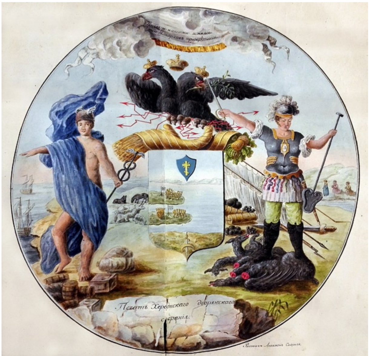
Проект печати Херсонского дворянского собрания.

С левой стороны щита изображён воин в древнем одеянии, стоящий твёрдо обеими ногами на семиглавом драконе, коему он отсёк три головы; в левой руке он держит железный заступ, приготовленный на отсечение последних глав поверженному дракону, а в правой - держит обнажённый меч над щитом к чёрному двуглавному орлу обращённый. Близ сего воина расположены знамёна, пушки бомбы, ядры, ружьё, пики и шпага. Вдали за рекой припали к земле на коленях две женщины в раз-