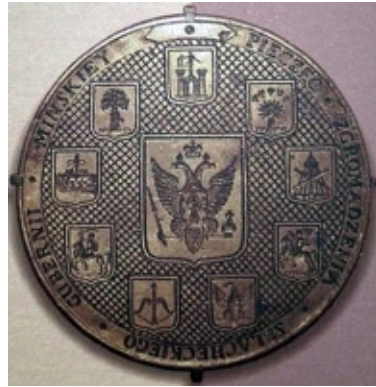
Печать Минского дворянского собрания конец XVIII в.