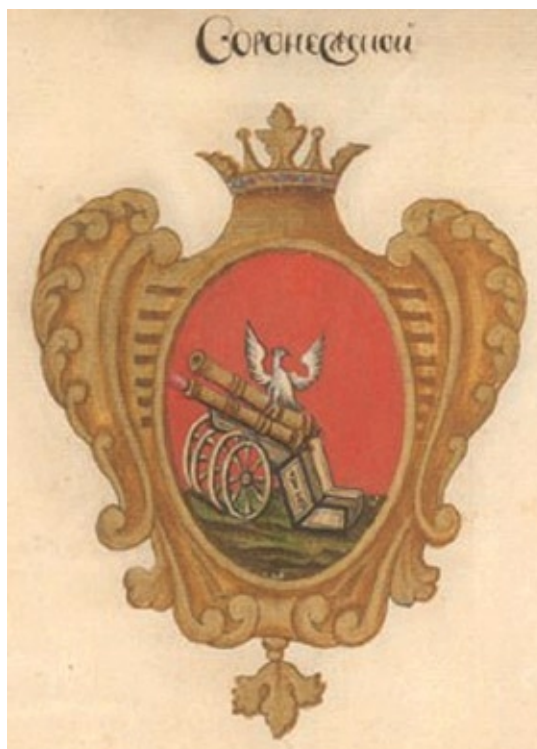
Воронежский герб 1730 года.