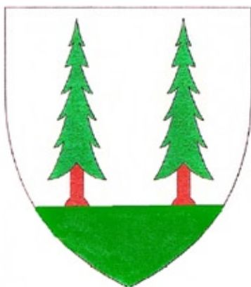
Реконструкция Воронежского герба с елями.