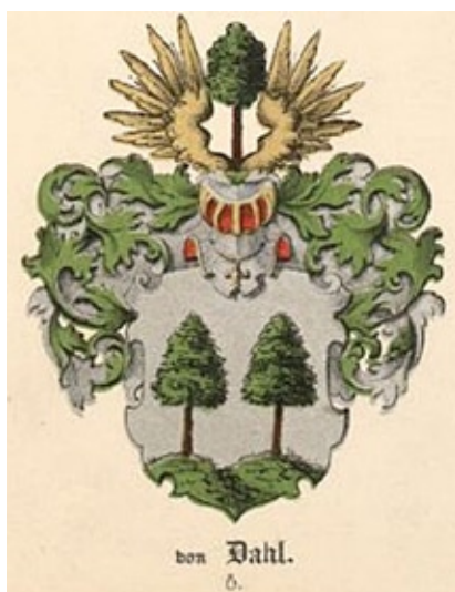
Герб рода фон Даль из Балтийского гербовника.

лал. Только у Чеботарёва не описана зелёная земля в воронежском гербе, а в других гербах, где есть земля, – описана.