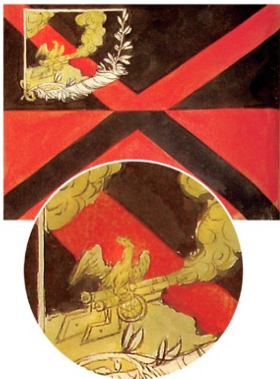
Эмблема на знамени Воронежского полка. 1712 г.

Известно несколько воронежских гербов. Один происходит из знаменных гербовников: «Воронежский, по старому, две пушки на станках жёлтых. из одной пушки выстрелено и на ней сидит орёл белый одноглавый, поле красное». Орла на этом гербе в XIX в. краеведы с исключительной гласностью герба называли вороной, вероятно, тоже белой, намекая на название реки Вороны и города Воронеж. 3 В правление Екатерины II появился и другой герб. В указе было сказано: «Город Воронеж имеет старый герб. Щит разделён надвое, в верхней части оно в золотом поле