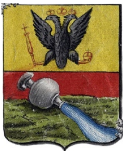
Герб Воронежа 1781 года из планов генерального межевания.

двуглавый чёрный орёл, а в нижней части, в красном поле опрокинутый на косогоре сосуд, из которого истекает река Воронеж». 1 И герб назван старым, хотя какой же он старый, если ему всего 37, то есть если его не было в знаменных гербовниках.