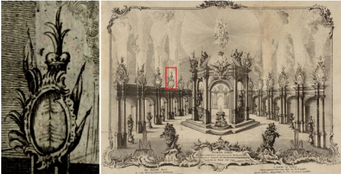
Воронежский герб на гравюре Новогодний фейерверк 1761года.

в аллегорическом представлении фейерверка, зажженного пред зимним её императорского величества домом, в новой 1761 год». В фейерверке было использовано 16 гербов губерний. И их состав и особенности изображения (что видно по архангелогородскому) соответствуют описаниям у Чеботарёва, нет лишь псковского. Один из гербов действительно с двумя елями, одна под другой. 1