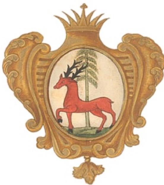
Герб Елецкий. 1730 год.