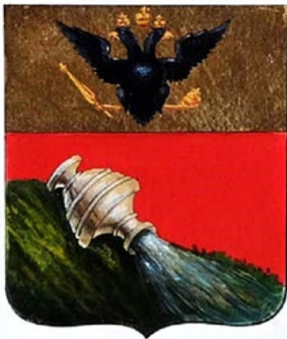
Герб Воронежа 1781 года из Полного собрания законов.