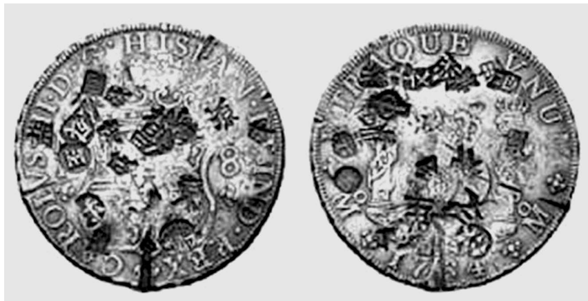
Илл. 3. Испанская монета с надчеканенными китайскими иероглифами. Филиппины, 1764 г.

Хотя данная монета относится к XVIII в. допустимо предположить, что подобные надчеканы имели место и ранее