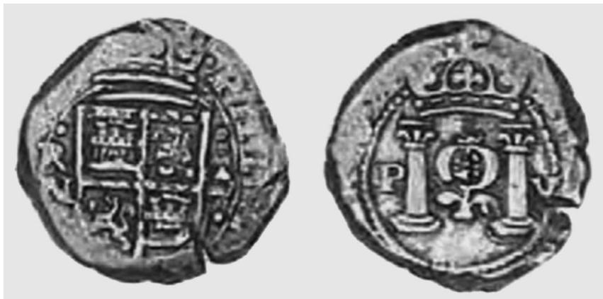
Илл. 2 Монета квартильо из биллона

На аверсе леоно-кастильский герб, на реверсе две колонны с гранатом посередине как знак монетного двора Санта-Фе, буквы P[LU]S V[LT]RA и инициал главы монетного двора. К сожалению, из-за плохой сохранности данного экземпляра, на монете его не видно. Легенда: «PHILIPPUS TERTIUS YSPANIAE ET INDIAE REX»