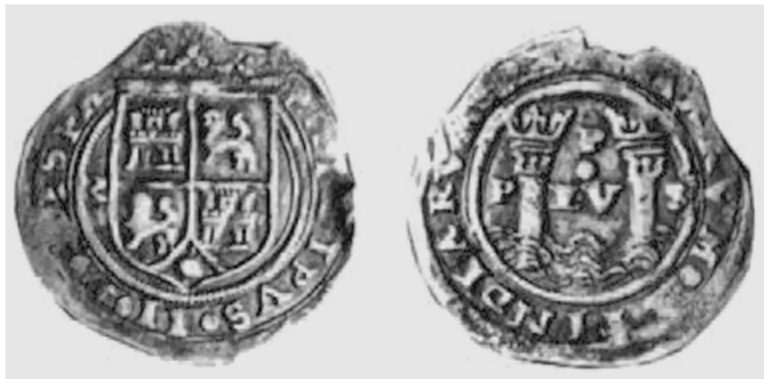
Илл. 1. Один реал Филиппа II, отчеканенный в Лиме (вице-королевство Перу)

160 г. На этих монетах были изображены гербы, а также знаки главы того монетного дома ( ensayador ), где они были отчеканены. Эти знаки были сделаны в виде инициалов или отдельных букв, с которых начиналась фамилия главы монетного дома 42 . Так, например, А. де ла Квадра (A. de la Quadra) обозначал себя буквой «Q», П.М. де Паленсия (P.M. de Palencia) – лигатурой из букв «PAL», Х.С. Мехия (J.S. Mejía) – буквой «M» и т.д. 43 Эти инициалы вполне обоснованно можно считать своеобразными изобразительными девизами, так как в XVII в. главы монетных домов к инициалам начали добавлять собственные знаки, размещая их между двух колонн на монете: так, в 1659 г. возглавлявший монетный дом в Лиме Ф. де Вильегас (F. de Villegas) на монете достоинством в 4 реала, уже традиционно обозначал себя буквой «V» и между Геркулесовых колонн разместил пятилучевую звезду. Тем самым он объединил собственный изобразительный девиз со ставшим государственным изобразительным девизом в виде Геркулесовых колонн.