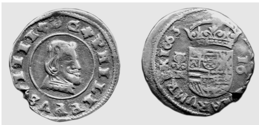
Илл. 5. Настоящая монета в 16 мараведи, чеканка Гранады, 1663 г.

связанных с фальсификацией и контрабандой, в преступления, связанные с «оскорблением величества» 62 , наказуемых смертью сожжением, потерей всего имущества и позором их потомков в двух поколениях» 63 (илл. 4, 5).