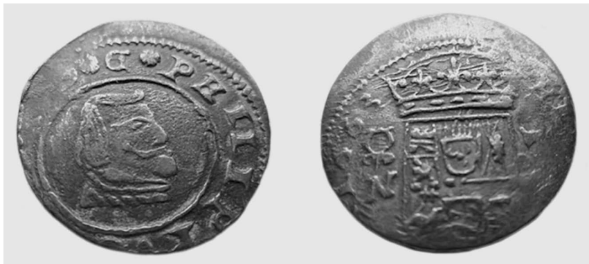
Илл. 4. Фальшивая монета в 16 мараведи, 1663 г. Вес 4,4 г, диаметр 26 мм. Якобы Гранадской чеканки