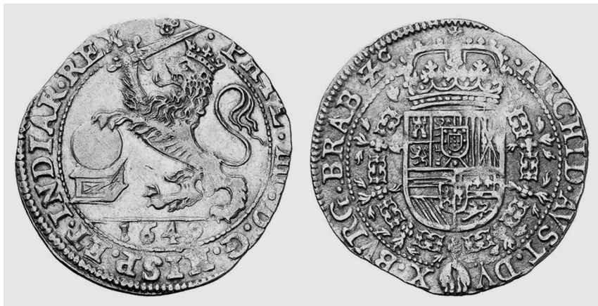
Илл. 6. Монета в 1 собрано. Филипп IV. 1649 г. Нидерланды. Золото. 5,54 г.

«IMPERII POTENTIA» («Мощь империи»), где король изображен сидящим на троне со львом, который держит в лапе меч слева от короля, и с мантикорой, находящейся справа от короля и держащей лапу на земном шаре. Чуть выше и геральдически справа (а фактически левее) расположен испанский герб с орденом Золотого Руна 75 . Таким образом, все элементы с этой эмблематической гравюры присутствуют на монете. Кстати, в легендах, имевших хождение до и во время правления Филиппа III, отмечалось наличие львов как королевских знаков или инсигний 76 . Отметим, что лев являлся одновременно и знаком Леона, и одной из гербовых фигур Бургундии, поэтому его значение в данной композиции может быть существенно больше, чем мы представляем (илл. 6–8).