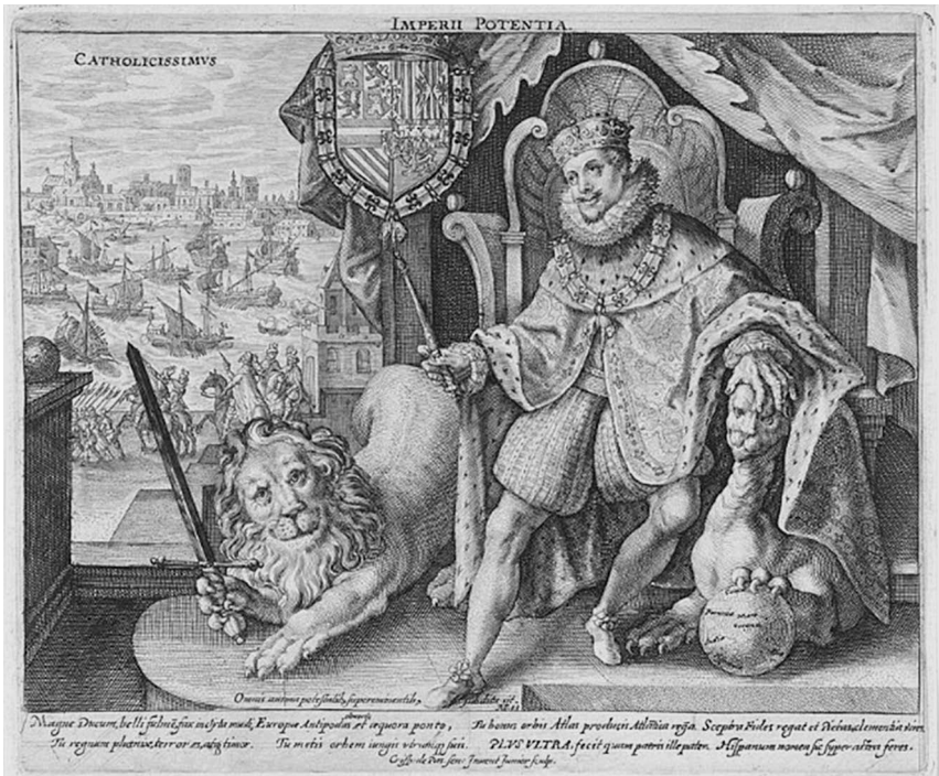
Илл. 7. Криспин ван де Пассе (II) Младший (Crispijn van de Passe (II) de Jonge, 1594–1670)

Портрет Филиппа III с гербом и изобразительными девизами. В картуше присутствует словесный девиз Карла V «Plus Ultra».