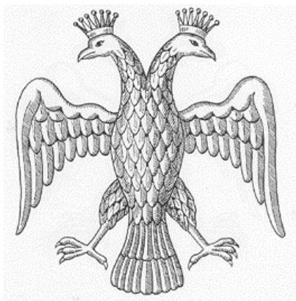
Рисунок 3. Двуглавый орёл на первом гербе России.

Как супруг последней византийской царевны, великий князь Московский становится как бы