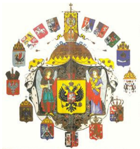
Рисунок 8. Большой Государственный герб России с 11 апреля 1857 года.

В описании герольдмейстера, барона Б.В.Кене. Большой государственный герб.