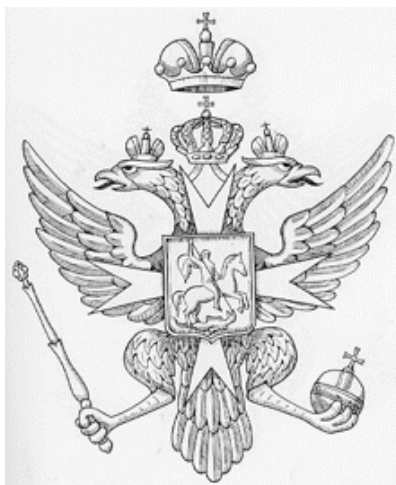
Рисунок 7. Двуглавый орёл при Павле I Романове с Мальтийским крестом.

российского герба. Его манифестом от 16 декабря 1800 года было дано его полное описание.