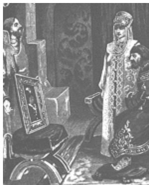
Рисунок 2. Перед Иваном III, в руках Антона Фрязина, портрет племянницы Константина XI, Зои Палеолог.

В 1471 году в Москву из Константинополя прибыл Антон Фрязин. Он привез для Великого князя Иоанна III портрет Зои Палеолог, племянницы последнего византийского императора Константина XI.