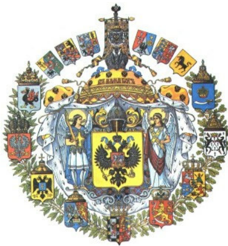
Рисунок 9. Большой Государственный герб России с 3 ноября 1882 года.

На золотом щите чёрный двуглавый орёл, коронованный двумя императорскими коронами, над которыми, посредине, такая же третья корона (несколько больших размеров, чем две предыдущие) с двумя развевающимися концами ленты Андреевского ордена. Орёл держит в лапах золотые скипетр и державу. На груди орла Московский герб. Щит увенчан шлемом святого,