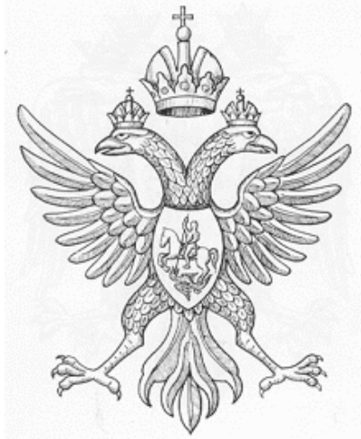
Рисунок 5. Двуглавый орёл на гербе первого из Романовых, Михаила.

отмечено также появление нового изображения гербового орла. Император Священной Римской империи Леопольд I, по просьбе царя, прислал в Москву своего герольдмейстера, Лаврентия Хурелевича. Который, в 1672 году составил “Титулярник”: “О родословии российских великих князей и государей, с показанием имевшегося, посредством браков, сродства между Россией и восемью европейскими державами, то есть Цезарем римским, королями английским, датским, испанским, польским, португальским и шведским, и с изображением оных королевских гербов, а в середине их великого князя св. Владимира, на конце же портрета, царя Алексея Михайловича” . Это рукопись с портретами всех великих князей и царей от Рюрика до Алексея Михайловича и с изображением 33 гербов земель, которые входили в титул русского царя.