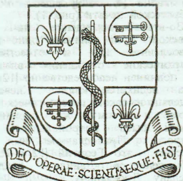
LUTON AND DUNSTABLE HOSPITAL