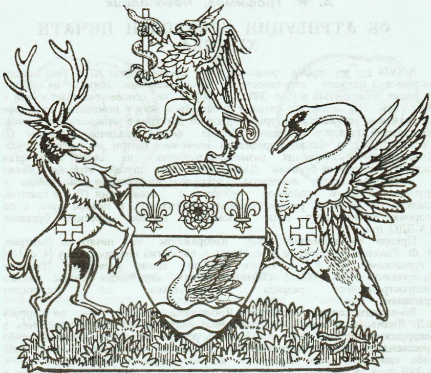
KING EDWARD VII HOSPITAL