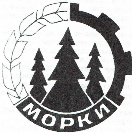
Проект герба Моркинского района советского периода