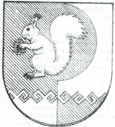
Утвержденный герб Моркинского района (16 марта 2005 г.)