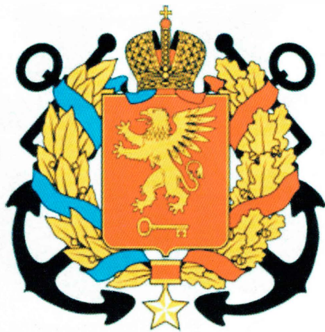
Большой герб Керчи (см. стр. 115)