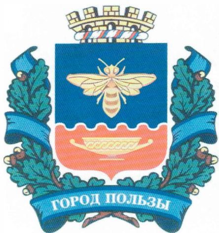
Проект герба Симферополя (см. стр. 22)