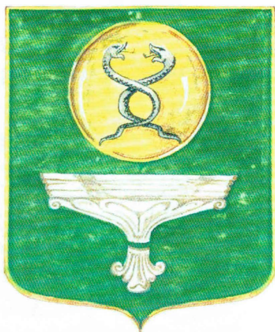
Проект герба Бахчисарая (см. стр. 38)