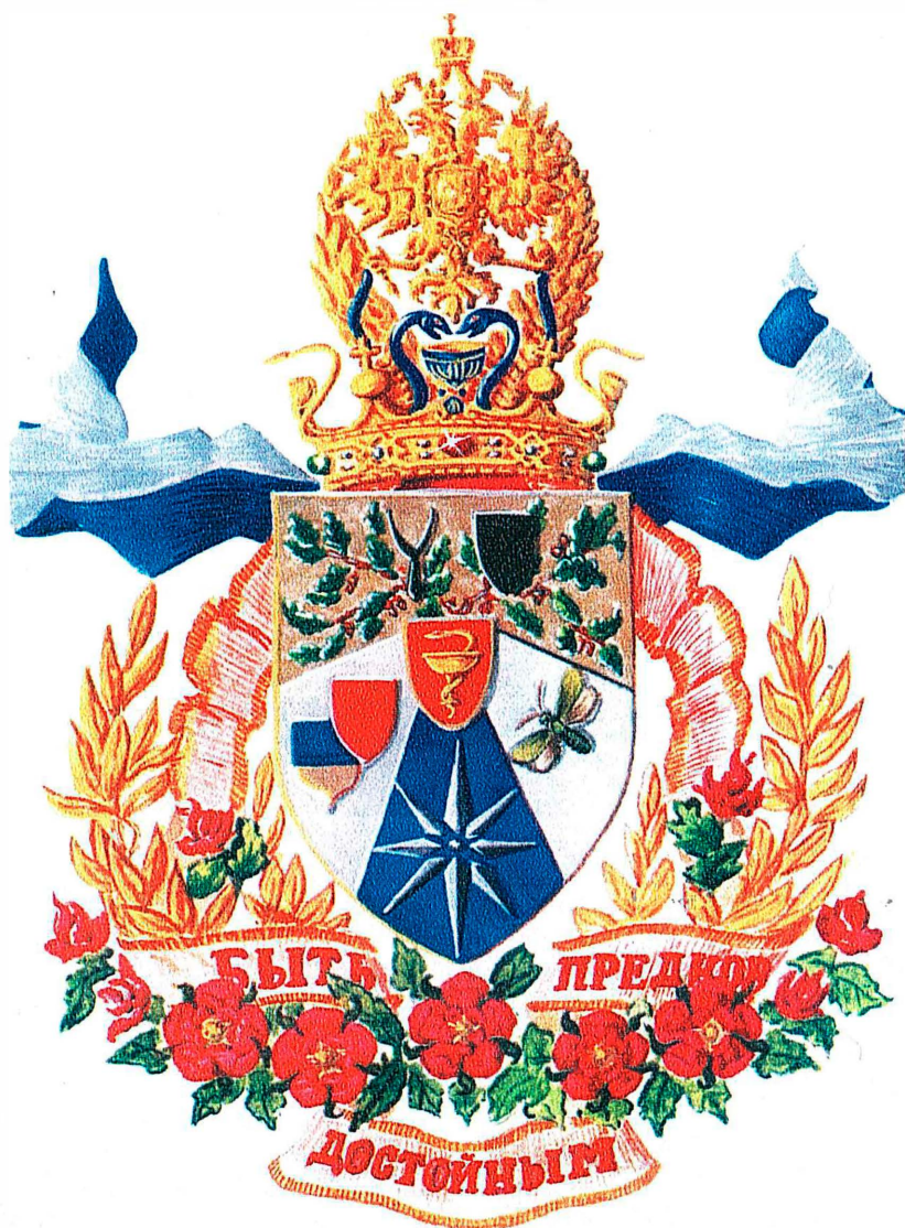
Династический герб врачей Ефетовых. Герб составил Г.Б. Ефетов. Изобразил Р.Ю. Кочкуров.