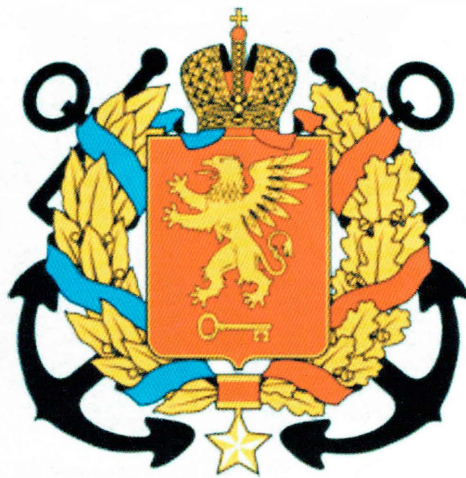
Большой герб Керчи (см. стр. 115)