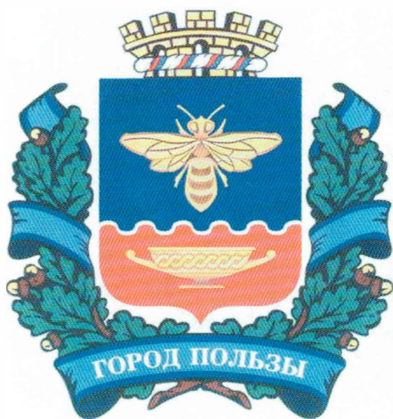
Проект герба Симферополя (см. стр. 22)