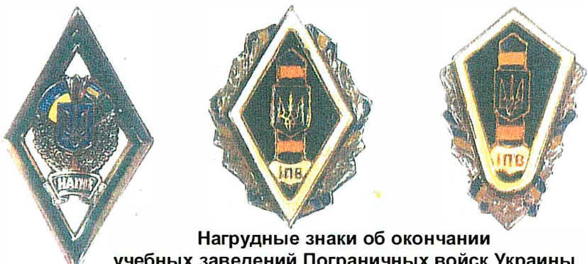
Нагрудные знаки об окончании учебных заведений Пограничных войск Украины