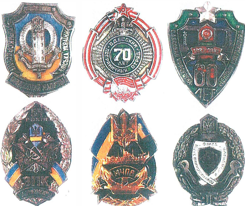
Юбилейные нагрудные знаки соединений и частей Южного направления Пограничных войск Украины