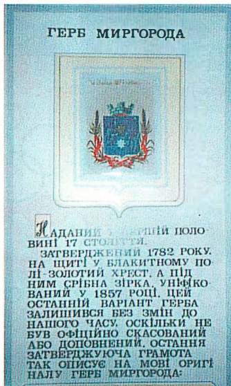
Герб города Миргорода в экспозиции Музея