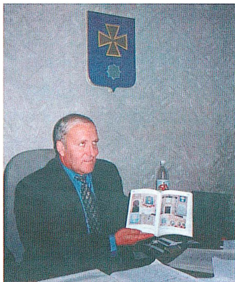
Мэр города Миргорода Александр Борисович Паутов