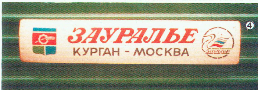
Ил. 1. Некоторые геральдические этикетки напитков Кургана.