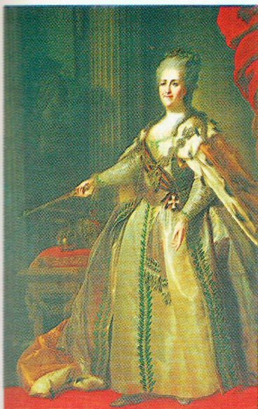
Императрица Екатерина II, учредительница ордена Св. Георгия.