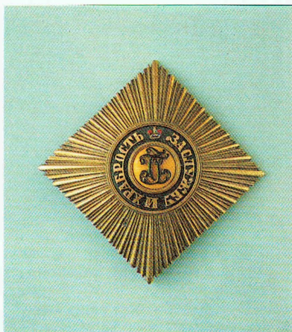
Звезда ордена Св. Георгия