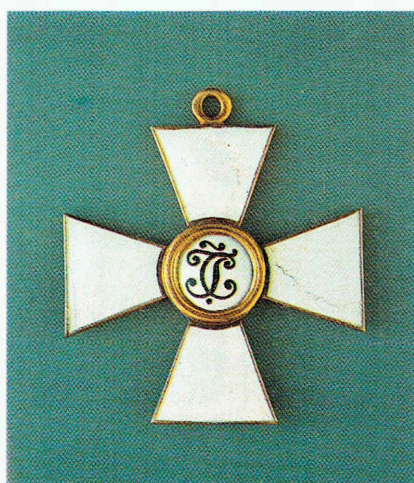
Знак ордена Св. Георгия 3-й (4-й) степени. Лицевая и оборотная стороны.