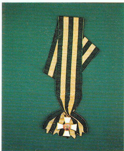
Знак ордена Св. Георгия 1-й степени