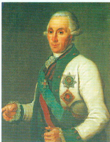
Адмирал С.К. Грейг, кавалер ордена Св. Георгия 2-й степени.