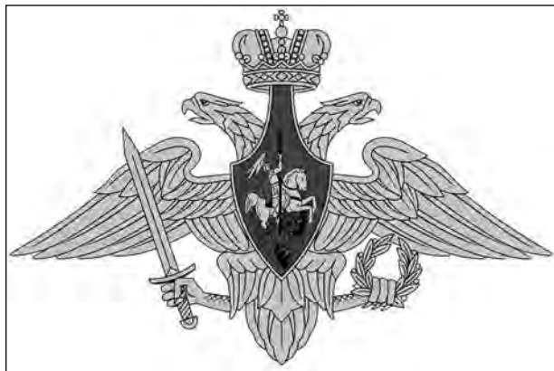
Эмблема Вооружённых сил РФ

Геральдическая основа такой преемственности существует в виде созданных на базе символики Российской империи и СССР официально учреждённых государственных и воинских символов современной России. Традиционно в армии России, как и в большинстве армий мира, воинские гербы являлись видоизменением герба государственного, а иногда и полностью совпадали с ним. Этим канонам отвечает и