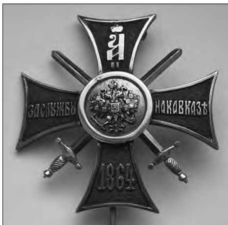
«Кавказский крест» образца 1864 г. и знак отличия «За службу на Кавказе» Вооружённых сил РФ

Неопределённость терминологии для гражданской сферы имеет непринципиальный характер, но в военной службе, где однозначное понимание сущности поставленных задач и управляющих команд является необходимым условием их эффек-