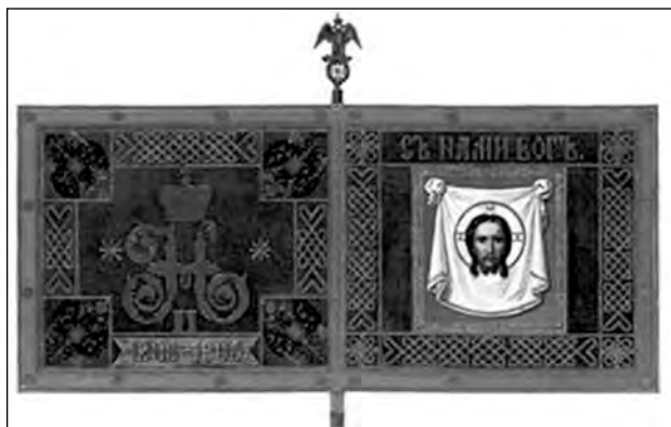
Георгиевское знамя лейб-гвардии Финляндского полка 1906 г.

ветского периода. Так, изображение узорной каймы и наличие надписей в ней почти повторяют рисунок каймы полотнища полкового знамени конца XIX — начала XX века. Красный цвет полотнища, изображения государственного герба на лицевой стороне и пятилучевых контурных звёзд в углах аналогичны одному из первых красных знамен советского периода.