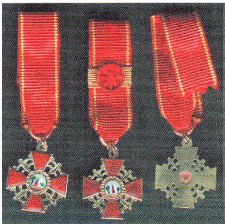
Миниатюры ордена Св. Анны 1-й и 3-й ст. (аверс, реверс)