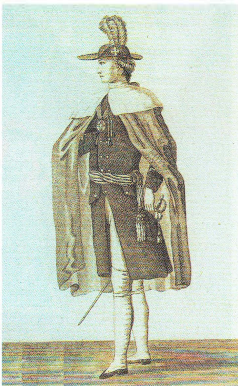
Орденские одеяния кавалеров ордена Св. Анны 1-й и 2-й ст. (рис. 1797 г.)