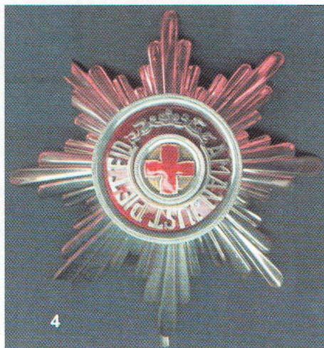
Знаки ордена Св. Анны: Крест (1-3), лента (2), звезда (3).