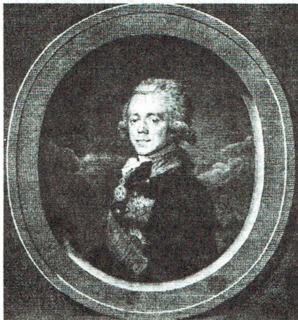
Император Павел I.