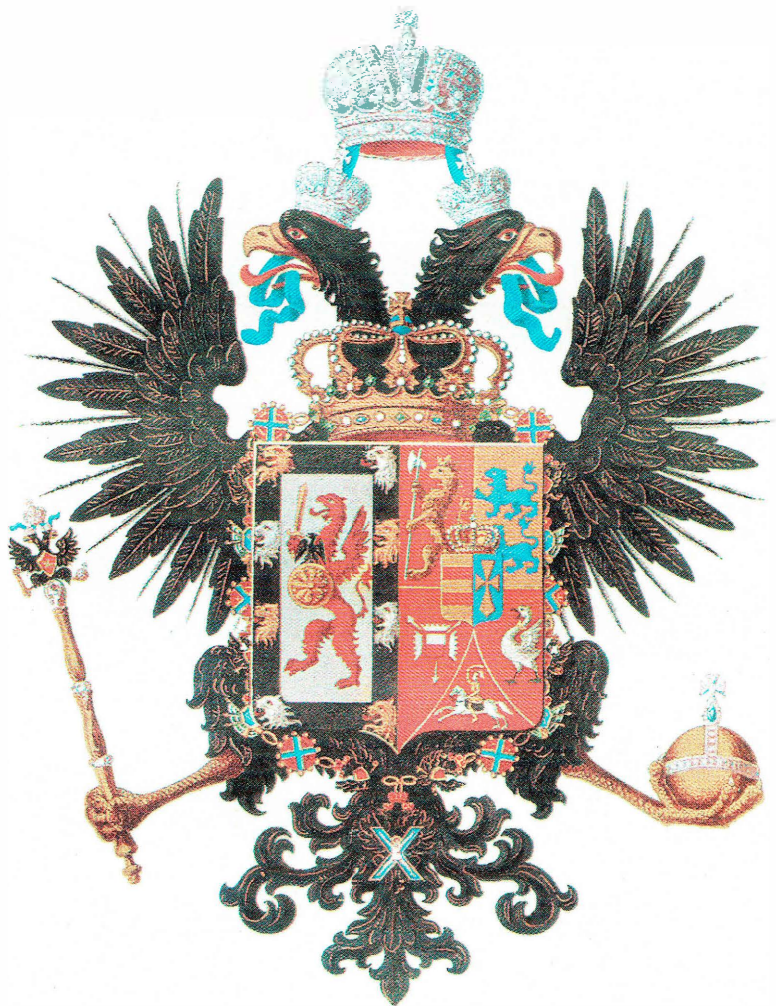
Родовой Его Императорского Величества герб.