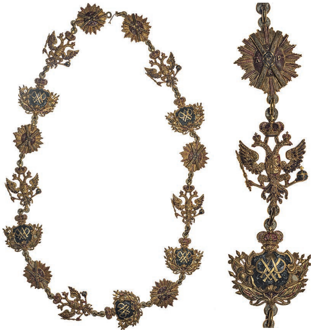
Ил. 21. Цепь ордена Святого Андрея Первозванного из 16 звеньев. XVIII век (?). Россия. Государственный Эрмитаж. Инв. № ЭРМ-874. Общий вид и фрагмент