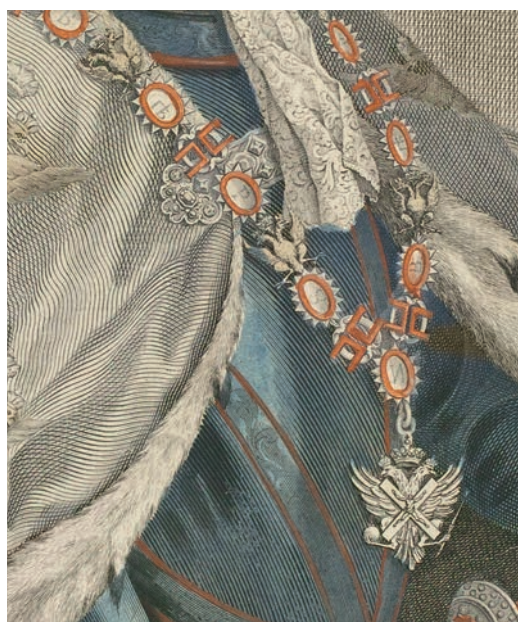
Ил. 5. П. Субейран по оригиналу Л. Каравака. Портрет Петра I. 1740-е. Государственный Эрмитаж. Инв. № ЭРГ-15035. Общий вид и фрагмент