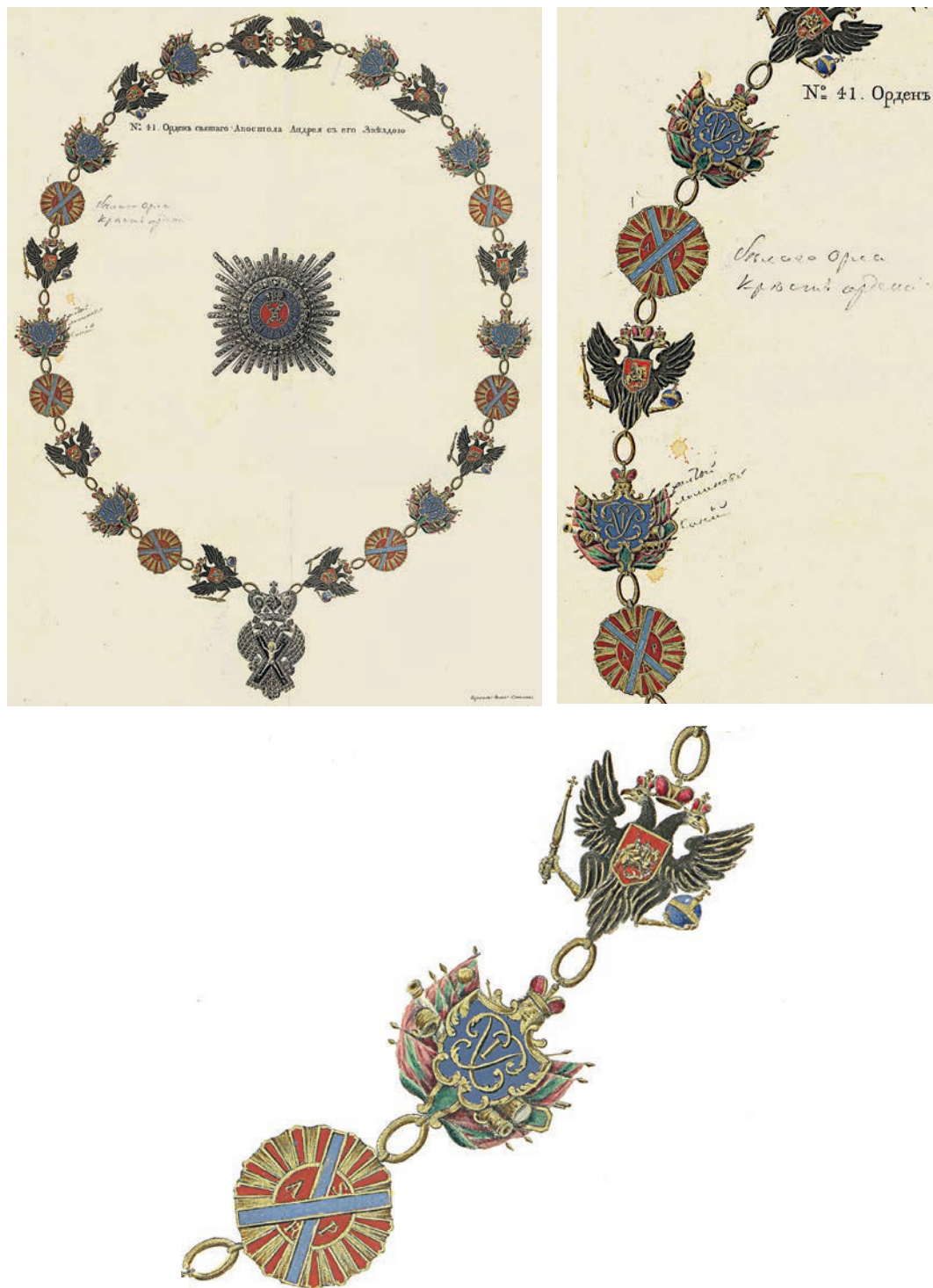
Ил. 10. И. А. Соколов. Цепь ордена Святого Андрея Первозванного из коронационного альбома Елизаветы Петровны. Государственный Эрмитаж. Инв. № ЭРГ-25711. Общий вид и фрагмент