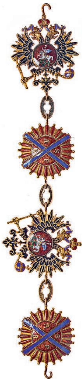
Ил. 17. Фрагмент цепи ордена Святого Андрея Первозванного из четырех звеньев. 1882–1898. Санкт-Петербург. Фирма «Кейбель». Государственный Эрмитаж. Инв. № ОН-Вз-459