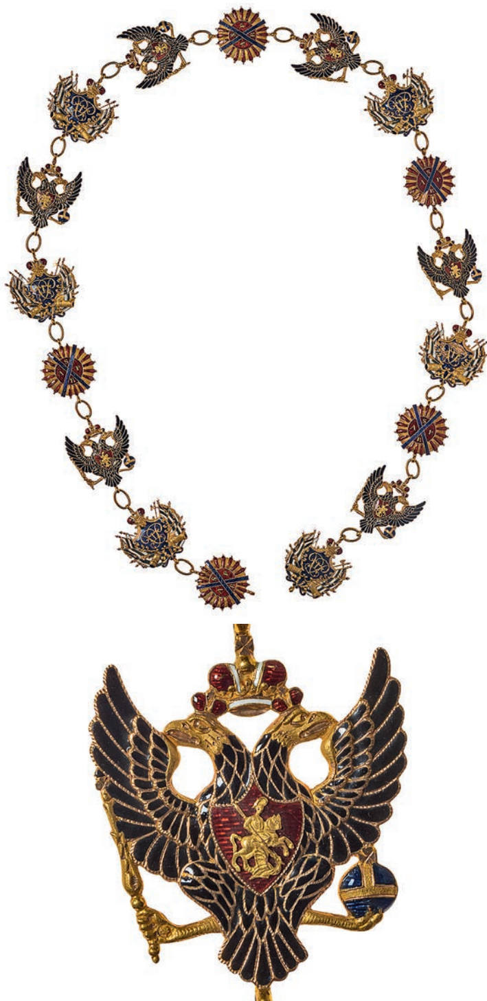
Ил. 14. Цепь ордена Святого Андрея Первозванного из 17 звеньев. 1839. Санкт-Петербург. Мастерская И. В. Кейбеля и Г. В. Кеммерера. Государственный Эрмитаж. Инв. № ОН-Вз-457. Общий вид и фрагмент