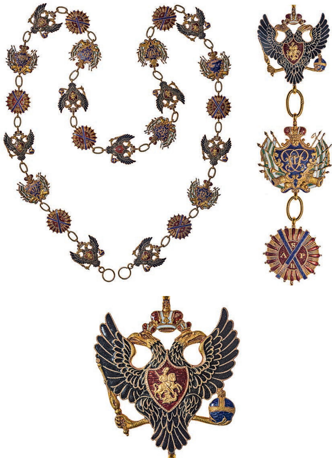
Ил. 13. Цепь ордена Святого Андрея Первозванного из 23 звеньев. 1836. Санкт-Петербург. Мастерская Э.-Г. Паннаша. Государственный Эрмитаж. Инв. № ОН-Вз-456. Общий вид и фрагменты