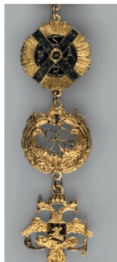
Ил. 23. Цепь ордена Святого Андрея Первозванного из 20 звеньев. XVIII век (?). Россия. Британский музей. Инв. № 1878,1101.130. Общий вид и фрагменты