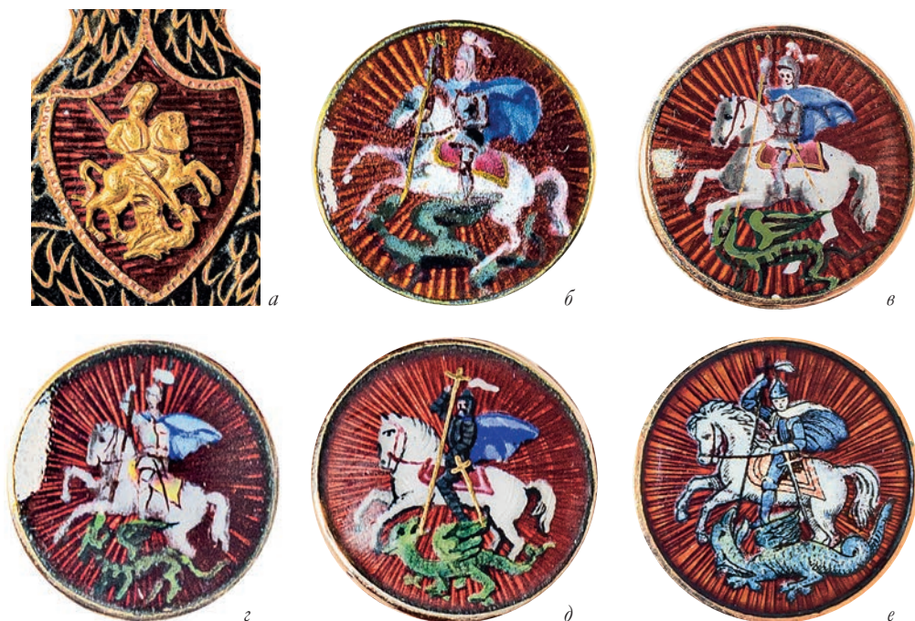
Ил. 20. Звенья орденских цепей со святым Георгием. Государственный Эрмитаж: а – 1836. Мастерская И. Паннаша. Инв. № ОН-Вз-456; б – 1856. Фирма «Кейбель». Инв. № ОН-Вз-1384; в – 1862. Фирма «Кейбель». Инв. № ОН-Вз-92; г – 1882–1898. Фирма «Кейбель». Инв. № ОН-Вз-459; д – 1898–1904. Фирма «Кейбель». Инв. № ОН-Вз-866; е – 1908–1910. Фирма «Эдуард». Инв. № ОН-Вз-458