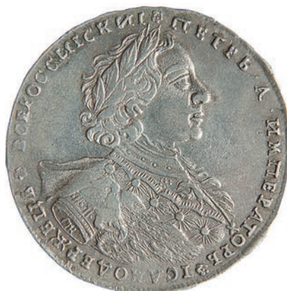
Ил. 7. Рубль Петра I. 1723. Россия. Медальер Осип Калашников. Государственный Эрмитаж. Инв. № ОН-Р-2-4504. Лицевая сторона

помещены выполненные в цвете инсигнии ордена Святого Андрея Первозванного (гравер И. А. Соколов).