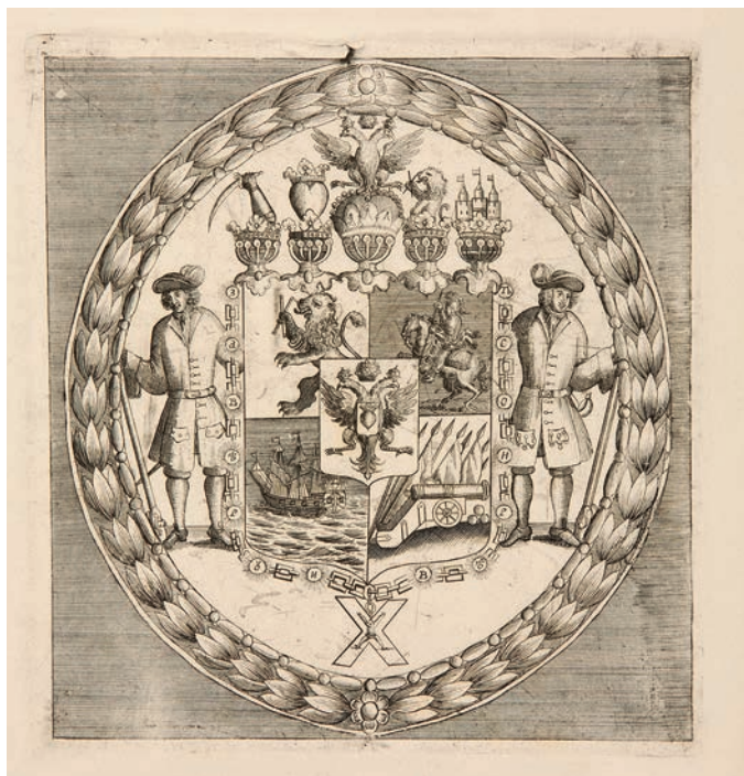
Ил. 2. А. Ф. Зубов. Герб князя Меншикова. Первая четверть XVIII века. Государственный Эрмитаж. Инв. № ЭРГ-6289