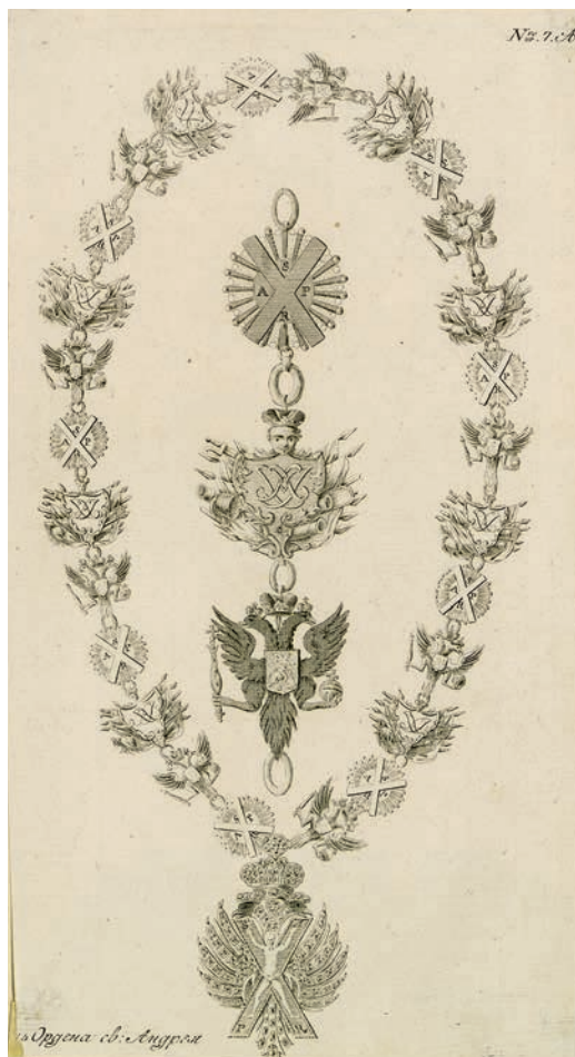
Ил. 8. Неизвестный гравер. Цепь ордена Святого Андрея Первозванного из коронационного альбома Анны Иоанновны. Государственный Эрмитаж. Инв. № ЭРГ-31605

В годы правления Елизаветы Петровны был разработан еще один проект Статута ордена Святого Андрея Первозванного, в 1744 году представленный императрице, но не подтвержденный ею. Содержащееся в нем описание цепи из 23 звеньев полностью совпадает с изображением из коронационного альбома. В проекте говорится о двух видах производства в кавалеры: «приватном» и «публичном» – и даются