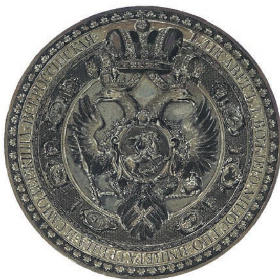
Ил. 3. И. А. Соколов. Изображение государственной печати из коронационного альбома Анны Иоанновны. Государственный Эрмитаж. Инв. № ЭРГ-25686