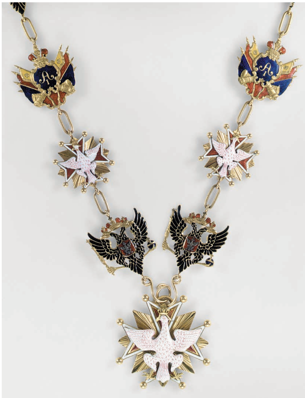
Ил. 11. Цепь ордена Белого Орла. Изготовлена к коронации Николая I. Фирма «Кейбель». Гохран России. Алмазный фонд. Общий вид и фрагмент