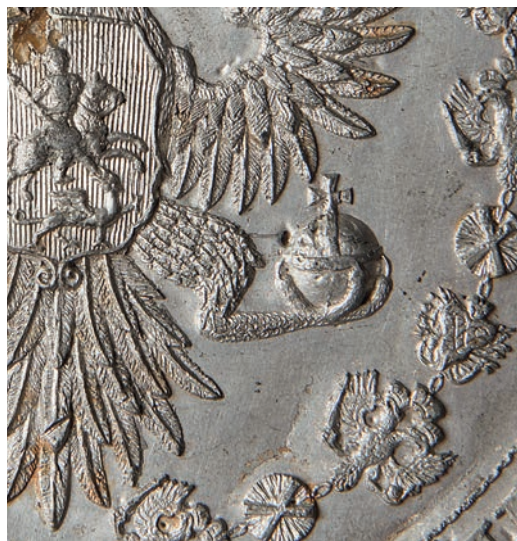
Ил. 9. Оттиск печати ордена Святого Андрея Первозванного. XVIII век (?). Государственный Эрмитаж. Инв. № Р-1599. Общий вид и фрагмент

их подробные описания. В первом случае знак с лентой «от нас самих... без дальнейших церемонии наложен быть». Во втором вручение орденских знаков происходило обычно в праздничные дни при собрании всех кавалеров. В этом случае кавалерам ордена Святого Андрея надевали орденский знак на цепи.