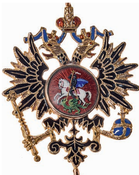
Ил. 18. Цепь ордена Святого Андрея Первозванного из 17 звеньев. 1898–1904. Санкт-Петербург. Фирма «Кейбель». Государственный Эрмитаж. Инв. № ОН-Вз-866. Общий вид и фрагмент