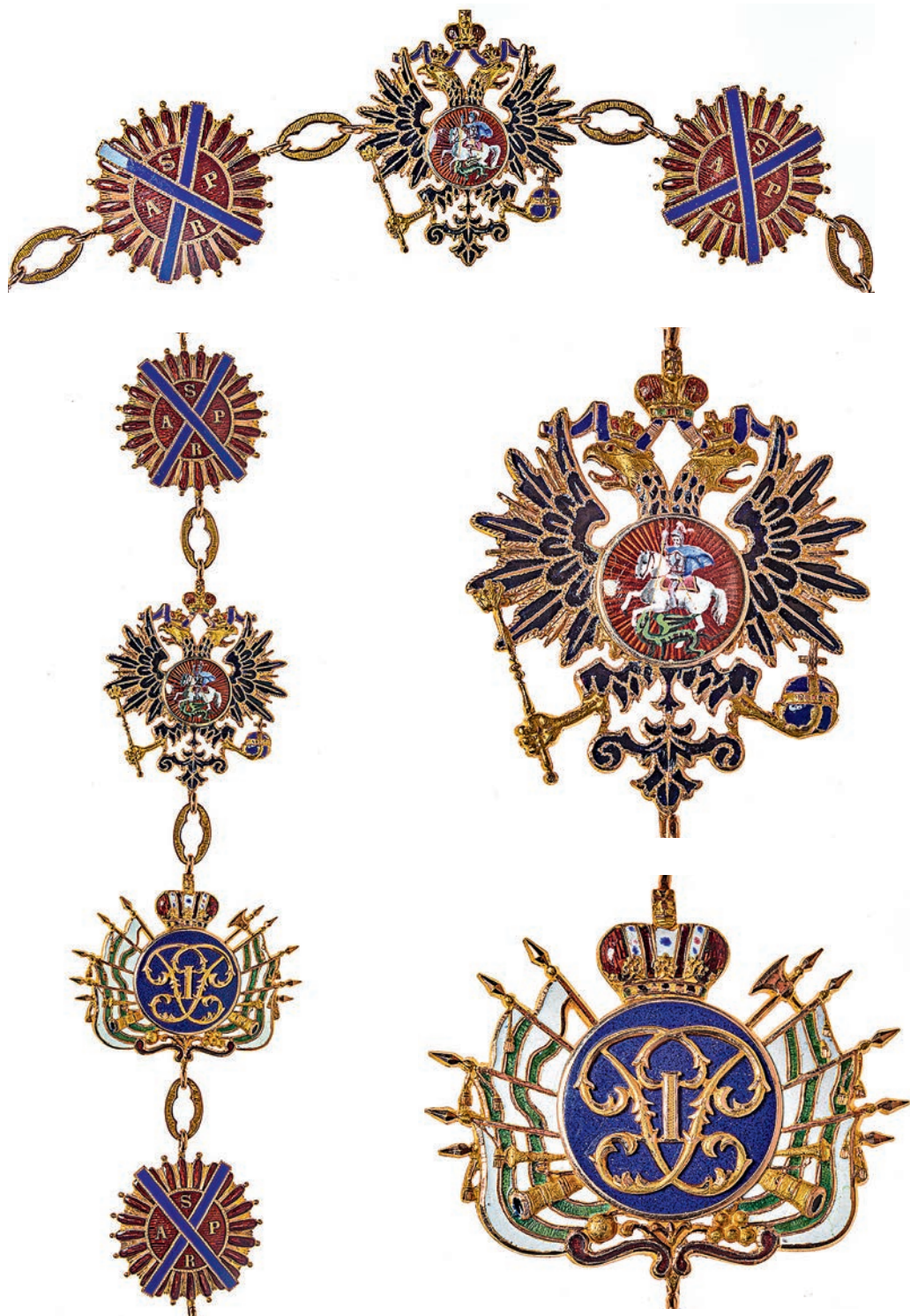
Ил. 16. Цепь ордена Святого Андрея Первозванного из 17 звеньев. 1862. Санкт-Петербург. Фирма «Кейбель». Государственный Эрмитаж. Инв. № ОН-Вз-92. Фрагменты