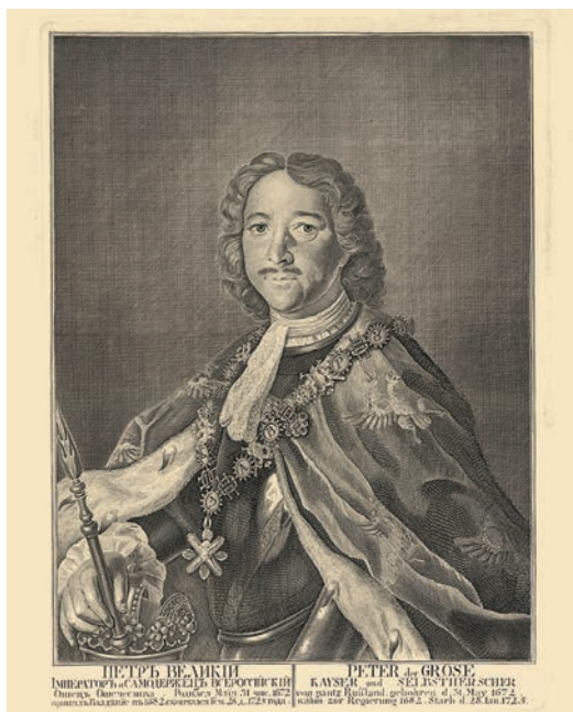
Ил. 4. И. А. Соколов по оригиналу Л. Каравака. Портрет Петра I. 1740-е. Государственный Эрмитаж. Инв. № ЭРГ-10658