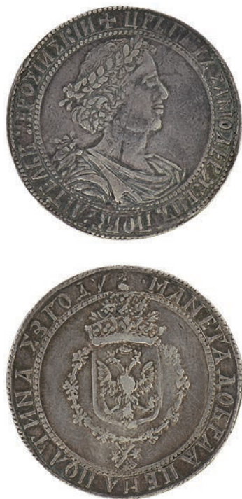
Ил. 1. Пробная полтина. 1699. Россия. Государственный Эрмитаж. Инв. № ОН-Р-2-170. Лицевая и оборотная стороны