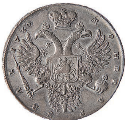
Ил. 6. Рубль Анны Иоанновны. 1730. Россия. Государственный Эрмитаж. Инв. № ОН-Р-2-5802 или 5805. Оборотная сторона