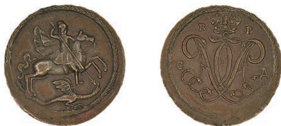
Ил. 22. Копейка Петра I. 1719. Россия. Государственный Эрмитаж. Инв. № ОН-р-2-3579. Лицевая и оборотная стороны