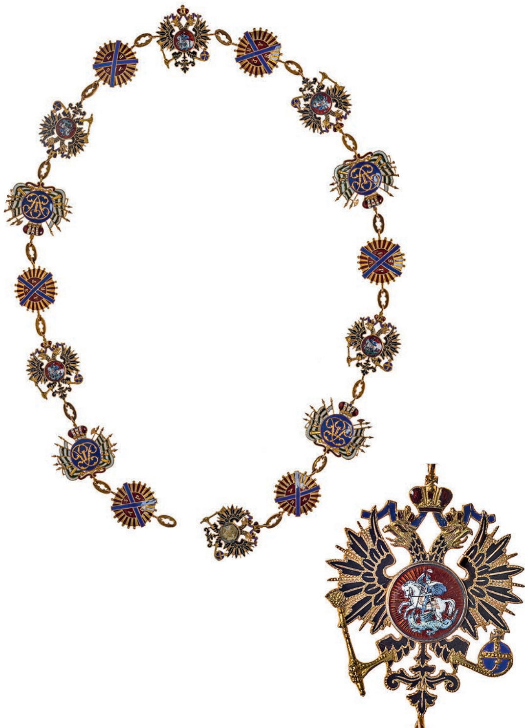
Ил. 19. Цепь ордена Святого Андрея Первозванного из 16 звеньев. 1908–1910. Санкт-Петербург. Фирма «Эдуард». Государственный Эрмитаж. Инв. № ОН-Вз-458. Общий вид и фрагмент