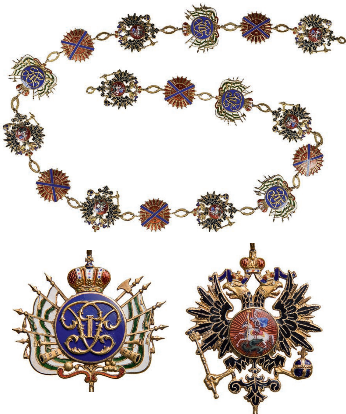
Ил. 15. Цепь ордена Святого Андрея Первозванного из 17 звеньев. 1856. Санкт-Петербург. Фирма «Кейбель». Государственный Эрмитаж. Инв. № ОН-Вз-1384. Общий вид и фрагменты