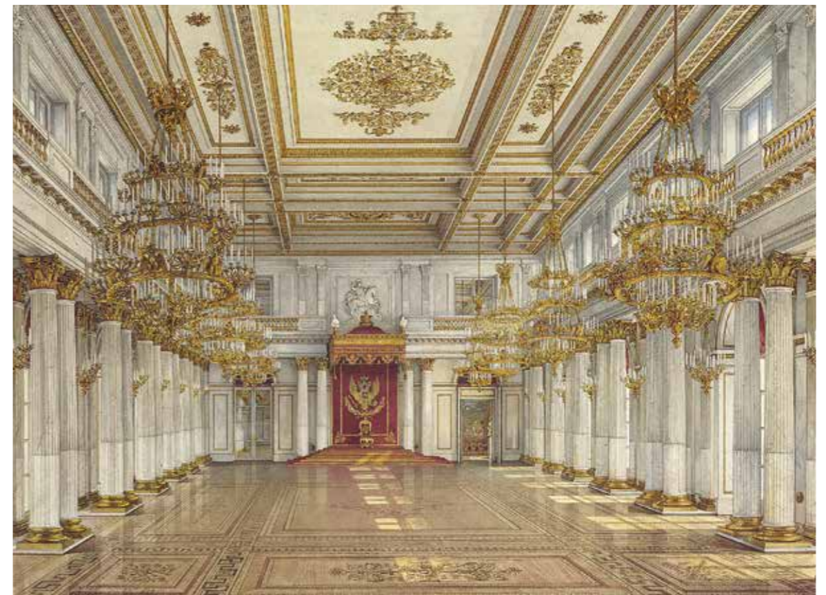
Ил. 6. К. А. Ухтомский. Виды залов Зимнего дворца. Парадные залы. Георгиевский зал. 1862. Инв. № ОР-14401. Государственный Эрмитаж

и Санкт-Петербургским Никанором был совершен молебен Святому Великому мученику и Победоносцу Георгию с возгласением многолетия Императорскому дому и Православному Всероссийскому Воинству, после чего святой водой были окроплены участники парада, знамена и штандарты 29 . Сразу по окончании торжеств для нижних чинов в Парадном коридоре был накрыт обед на 600 человек, куда к двум часам спустились император и великие князья. Для георгиевских кавалеров обед на 412 человек был дан в Гербовом зале в 4 часа. Согласно плану рассадки места рядом с императором занимали старейшие кавалеры 2-й и 3-й степеней ордена Св. Георгия. Остальные кавалеры ордена располагались за столом согласно Табели о рангах: по степеням, а в степенях по старшинству 30 . Присутствовавшая на Георгиевском празднике 1855 года фрейлина императрицы Марии Александровны А. Ф. Тютчева оставила в своем дневнике следующую запись: «Состоялся большой выход в парадных мундирах к обеду и молебну по случаю праздника ордена Георгиевских