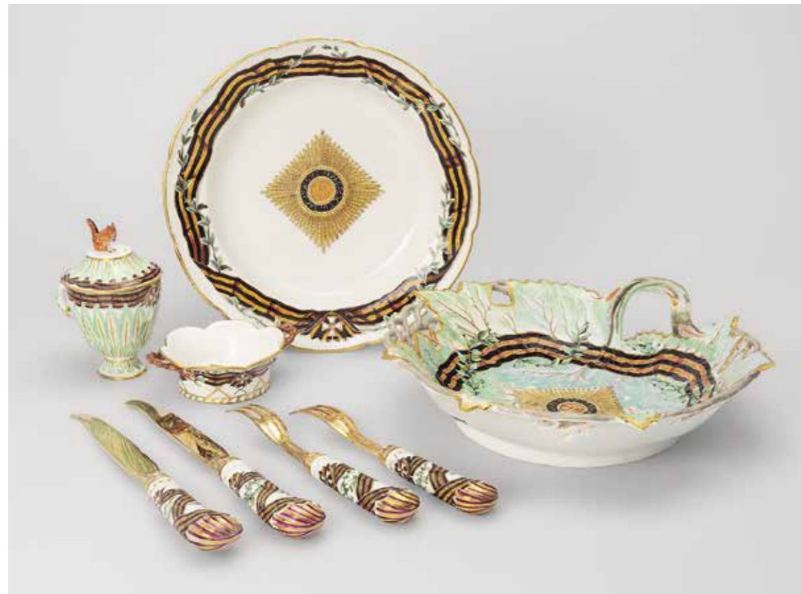
Ил. 3. Предметы из Сервиза ордена Св. Великомученика и Победоносца Георгия (Георгиевского сервиза). Россия, Московская губерния, Дмитровский уезд, село Вербилки. 1777–1778. Фарфоровый завод Ф. Я. Гарднера. Проект Г. И. Козлова. Инв. № ЭРФ-316, 4505, 320, 6871, 9562, 9566, 9572, 9573. Государственный Эрмитаж