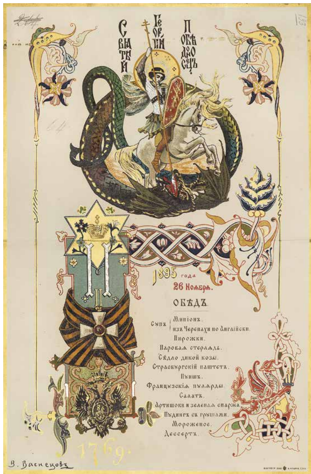
Ил. 11. В. М. Васнецов. Меню обеда в Зимнем дворце 26 ноября 1895 года в день орденского праздника Св. Великомученика и Победоносца Георгия. 1895. Из альбома графа В. А. Адлерберга. Инв. № 311297. Государственный Эрмитаж

Лейб-Гвардии Преображенского полка, с цепью ордена Св. Андрея Первозванного и с александровской лентой.