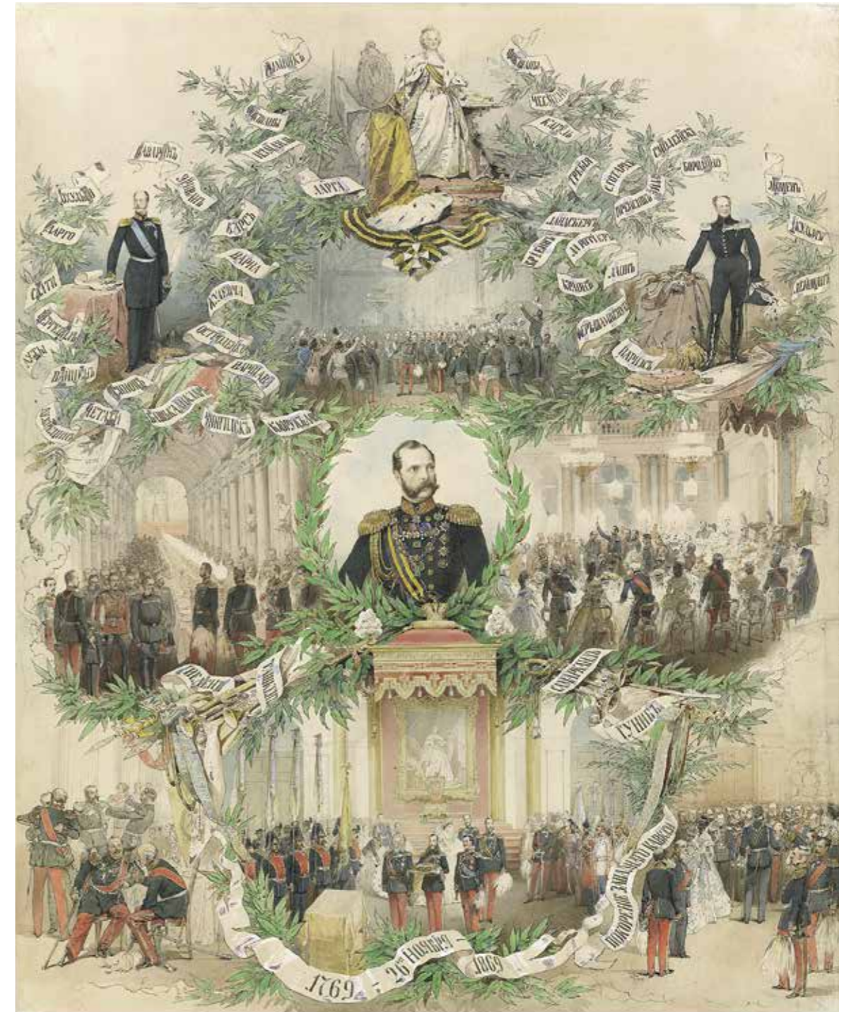
Ил. 7. М. А. Зичи. Празднование 100-летия ордена Св. Георгия в Зимнем дворце 26 ноября 1869 года. 1871. Инв. № ЭРР-7222. Государственный Эрмитаж

27 ноября на Дворцовой площади состоялся парад с участием георгиевских кавалеров. В Георгиевском зале Зимнего дворца разместились все знамена и штандарты войск, находившиеся в Санкт-Петербурге и окрестностях. Войсковые подразделения от пехоты, кавалерии, артиллерии, инженерных войск и флотских экипажей были выстроены на площади. Сюда после молебна из