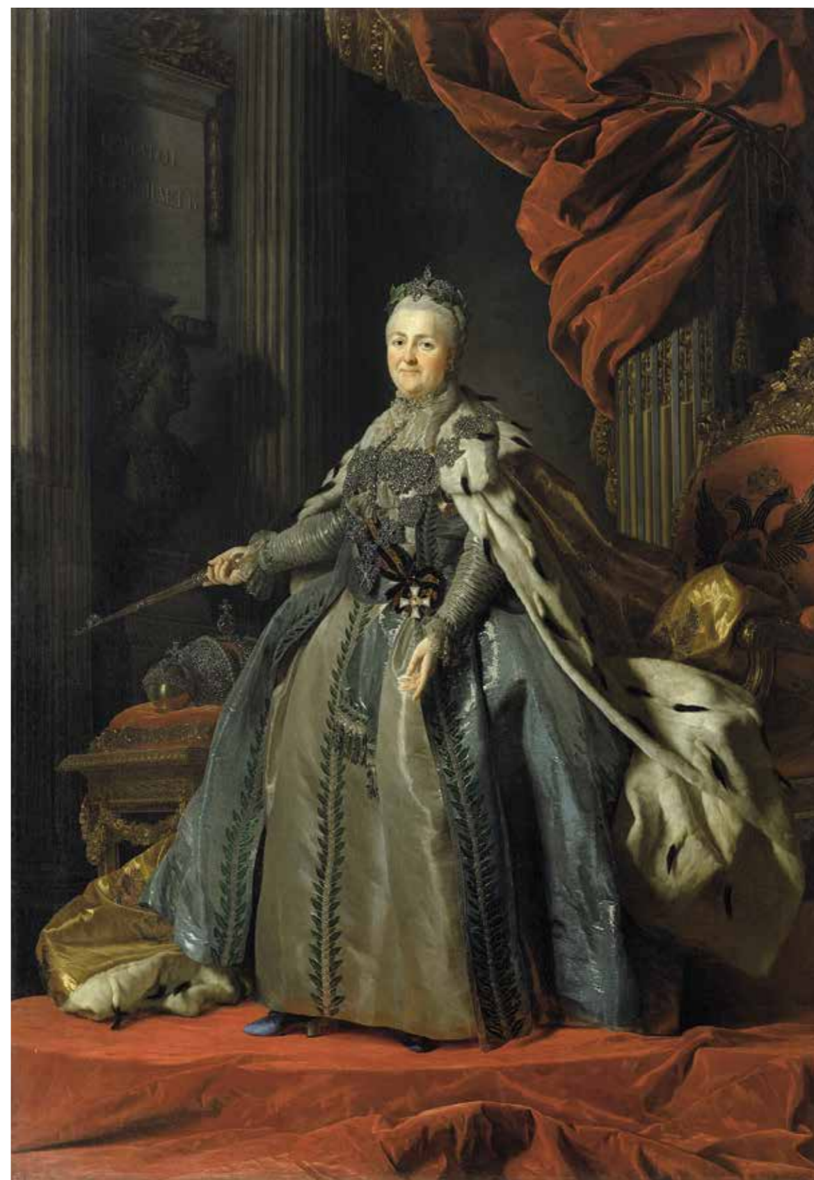
Ил. 2. А. Рослин. Портрет Екатерины II. Конец 1776 – начало 1777. Инв. № ГЭ-1316. Государственный Эрмитаж

в День георгиевских кавалеров. 24 ноября всем приглашенным во дворец на празднование Дня святой Екатерины были разосланы повестки, информирующие о готовящемся торжестве. 26 ноября приглашенные съезжались в Зимний дворец к 11 часам. Через час из своих апартаментов вышли Екатерина II (ил. 2) «в орденской одежде» и цесаревич Павел, сопровождаемые «знатными обоюбого пола персонами» и иностранными министрами. Шествие направилось в придворную церковь, где архиепископом Санкт-Петербургским Гавриилом была отслужена литургия. По ее окончании в церковь был внесен стол с лежащими на золотом блюде орденскими знаками. Статс-Секретарь Ее Императорского Величества С. Ф. Стрекалов прочел Статут ордена, после чего архимандрит Троице-Сергиевской лавры Платон произнес проповедь и произвел освящение орденских знаков. Под воспевание хором певчих многолетия и пушечную пальбу с Санкт-Петербургской и Адмиралтейской крепостей из 101 выстрела Екатерина II собственноручно возложила на себя знаки ордена. Затем последовали поздравления от лиц, присутствовавших на церемонии. Воинские