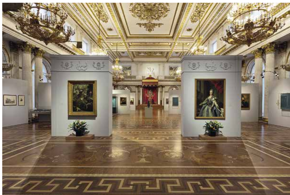
Ил. 1. Выставка «За службу и храбрость. 250 лет со дня учреждения ордена Святого Георгия» в Государственном Эрмитаже. 3 декабря 2019 года. Фотография. Государственный Эрмитаж

находился правящий монарх. Их организация и проведение зависели от ряда причин, как политических, так и внутрисемейных (военные действия, учреждение Государственной думы, траур, болезнь и т. п.). В ходе подготовки торжественных мероприятий утверждались повестки, списки приглашенных, порядок высочайшего выхода, планы парадов и рассадок, меню, программы музыки, образцы билетов и т. д. По всем затратам велась строгая финансовая отчетность, в которой учитывались все, даже самые мелкие расходы. Иногда 26 ноября выбиралось для принесения присяги великими князьями.