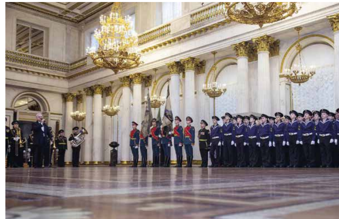
Ил. 14. День св. Георгия в Государственном Эрмитаже. 9 декабря 2018 года. Фотография. Государственный Эрмитаж

Ни один из орденских праздников в Российской империи не был столь масштабным, не вовлекал в торжества такого количества людей,