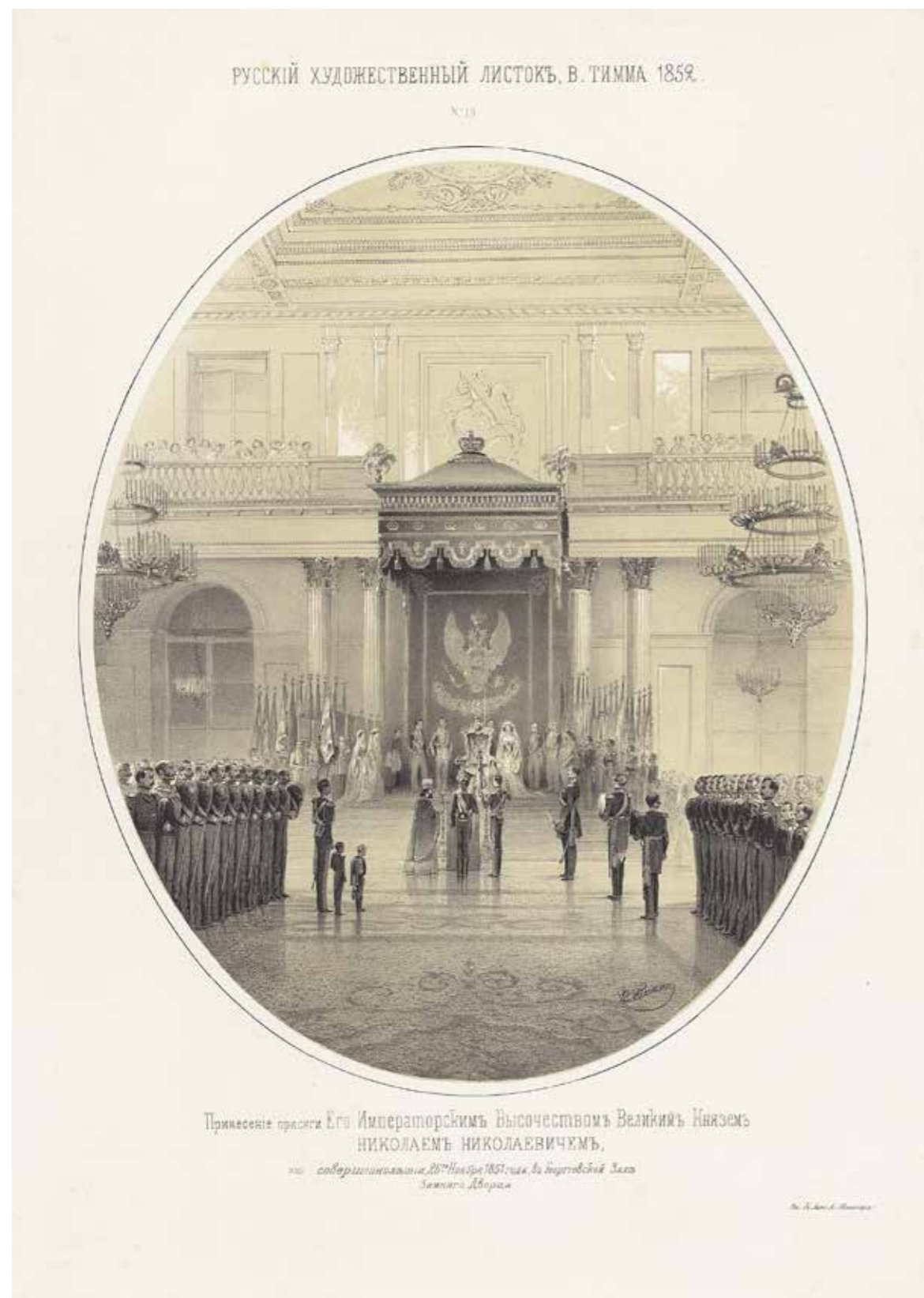
Ил. 5. В. Ф. Тимм по собственному оригиналу. Изображение принесения присяги великим князем Николаем Николаевичем 26 ноября 1851 года в Георгиевском зале Зимнего дворца. Воспроизводится по: Русский художественный листок В. Тимма. 1852. № 19. Инв. № ЭРГ-4001. Государственный Эрмитаж

были расставлены нижние чины, имевшие Знак отличия Военного ордена. В Георгиевском зале под командированием великих князей Николая и Михаила Николаевичей выстроились строевые чины из воинских частей Санкт-Петербурга и окрестностей со знаменами и штандартами. В Портретной галерее находились отставные нижние чины, состоявшие на службе при Высочайшем дворе, в том числе при дворцовых арсеналах и караулах. У дверей залов, через которые следовало шествие, было поставлено по два лакея, имевших георгиевские знаки. В 11-м часу император вместе с великими князьями провел смотр нижних воинских чинов. По его окончании состоялся Высочайший выход. На службе в Большой церкви присутствовали только старшие георгиевские кавалеры, придворные дамы и чины; кавалеры младших орденских степеней в это время находились в Пикетном зале. После литургии император, в сопровождении духовенства и лиц, принимавших участие в высочайшем выходе, направился в Георгиевский зал. Там митрополитом Новгородским