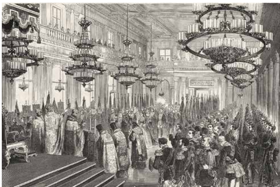
Ил. 8. Юбилей ордена Св. Георгия: молебствие и окропление святой водой ордена в Георгиевской зале Зимнего дворца 26 ноября 1869 года. Воспроизводится по: Всемирная иллюстрация. 1870. № 53. С. 8. Государственный Эрмитаж

дворца в сопровождении императора и взвода от роты Дворцовых гренадер были вынесены знамена и штандарты. Александр II верхом объехал парадный расчет и остановился у памятника Александру I, мимо которого церемониальным маршем прошли войска. После этого в Зимнем дворце состоялся «фрыштик», на котором присутствовали кавалеры ордена и высшие чины, награжденные Знаком отличия Военного ордена или золотым оружием. За столами, накрытыми на 740 персон, присутствовало 536 человек. Звучали тосты за здоровье георгиевских кавалеров, Александра II и прусского короля Вильгельма I, пожалованного днем ранее 1-й степенью ордена. 28 ноября в Георгиевском и Гербовом залах и Портретной галерее Зимнего дворца был дан торжественный обед на 1000 персон (присутствовало 798). Во время него из внутренних покоев были вынесены орденские знаки Екатерины II, остававшиеся в Георгиевском зале на протяжении всей трапезы 33 .