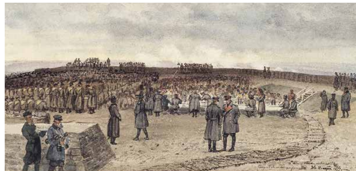
Ил. 9. Е. К. Макаров. Георгиевский праздник на Радишевской высоте под Плевной 26 ноября 1877 года. 1878. Инв. № ЭРР-921. Государственный Эрмитаж

В годы царствования Александра III была продолжена традиция проведения парадов в День