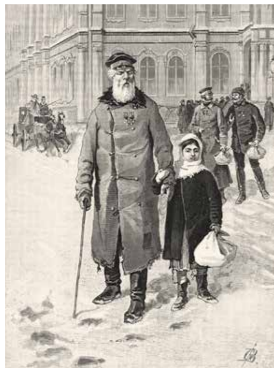
Ил. 13. Георгиевский праздник – 26 ноября. Георгиевский кавалер, возвращающийся из Зимнего дворца.

Император 26 ноября 1915 года находился в Ставке в Могилеве. Согласно записи в его дневнике: «К 10 час. на площадке перед домом построились: офицеры – Георгиевские кавалеры по одному от корпуса и подпрапорщики по два от