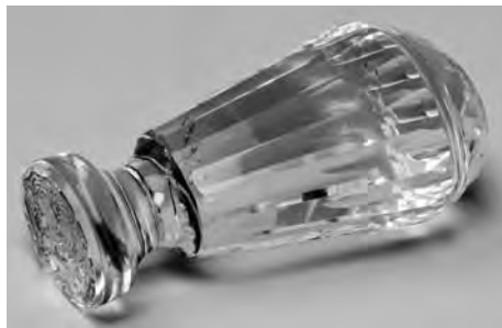
Рис. 7. Печать с гербами князей Юсуповых и графов Сумароковых. Россия. Конец XIX в. Горный хрусталь; резьба по камню. Государственный Эрмитаж. Санкт-Петербург. Инв. № ИП – 231

Последняя из печатей, также переданная в Государственный Эрмитаж в составе коллекций бывшего Гербового музея, несет на себе гербы графов Сумароковых и князей Юсуповых (рис. 6) 9 . Выполнена она из горного хрусталя и имеет форму сужающейся книзу колонки. На овальной матрице, на княжеской мантии, увенчанной княжеской короной, два соединенных герба, в свою очередь увенчанные