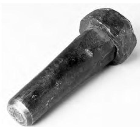
Рис. 4. Печать-штамп с гербом князей Юсуповых. Общий вид. Россия. XVIII в. Железо; чеканка. Государственный Эрмитаж. Санкт-Петербург. Инв. № ИП – 250