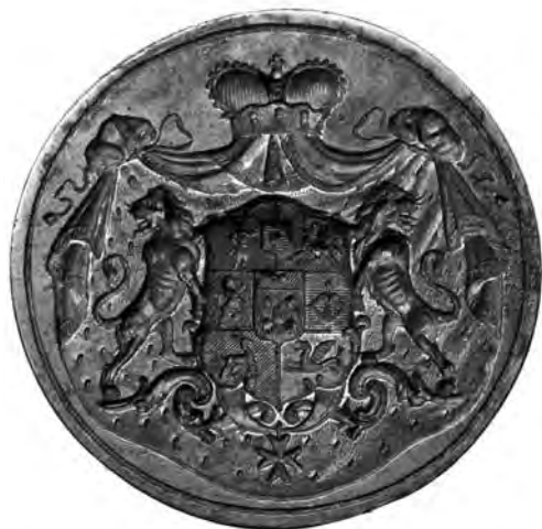
Рис. 3. Печать князя Николая Борисовича Юсупова-старшего. Россия. Не ранее 1798 г. Сталь, слоновая кость; чеканка, резьба по кости. Государственный Эрмитаж. Санкт-Петербург. Инв. № ИП – 251

В историографии известны ранние варианты герба князей