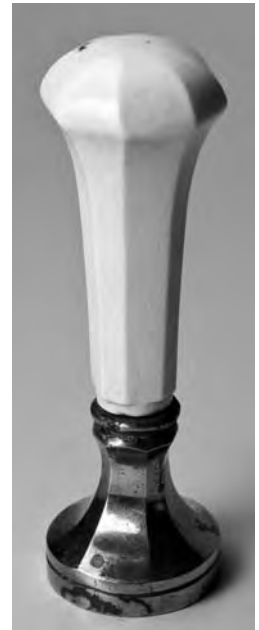
Рис. 1. Печать князя Николая Борисовича Юсупова-старшего. Общий вид. Россия. Не ранее 1798 г. Сталь, слоновая кость; чеканка, резьба по кости. Государственный Эрмитаж. Санкт-Петербург. Инв. № ИП – 251.

Особый интерес для специалистов представляет стальная печать с костяной ручкой, согласно карточке, составленной В.К. Лукомским, принадлежавшая гофмейстеру, тайному советнику князю Николаю Борисовичу Юсупову (1827–1879). На ее матрице вырезан герб князей Юсуповых, имеющий отличия от утвержденного (рис. 1) 1 . Напомним описание герба князей Юсуповых, внесенного в третью часть «Общего гербовника дворянских родов», утвержденную 19 января 1799 г. 2 : в овальном, разделенном на 6 частей щите, помещены 2 щитка: в центре – щиток с изображением княжеской шапки в зеленом поле, под ней, в красном поле 4 шестиконечные серебряные звезды, окружающие серебряный полумесяц, обращенный рогами вправо; над ним щиток с серебряной шестиконечной звездой в