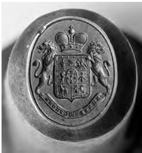
Рис. 5. Печать-штамп с гербом князей Юсуповых. Россия. XVIII в. Железо; чеканка. Государственный Эрмитаж. Санкт-Петербург. Инв. № ИП – 250