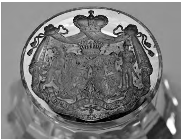
Рис. 6. Печать с гербами князей Юсуповых и графов Сумароковых. Общий вид. Россия. Конец XIX в. Горный хрусталь; резьба по камню. Государственный Эрмитаж. Санкт-Петербург. Инв. № ИП – 231