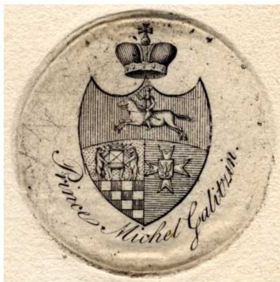
Ил. 7. Копия экслибриса князя М.Н. Голицына (1796–1863). Конец XIX в. Офорт. 78x70, D-41. Коллекция П.Д. Эттингера из собрания ГМИИ им. А.С. Пушкина. Инв. № ГЭ-6361.

и замечаний» 20 (ил. 6). В дополнение к веским аргументам К.Г. Боленко следует добавить также факт, который упоминает Розенбладт, ссылаясь на Рейхмана. Последний, в свою очередь, настаивает на принадлежности этого экслибриса Михаилу Николаевичу, да и бумага, использованная для этого экслибриса, может датироваться только второй четвертью XIX в. 21 Правда, есть у этого знака и новоделы, как упоминают Розенбладт и Богомолов. Чаще всего в них композиция герба расположена на фоне круга 22 и исполнена в технике офорта (ил. 7). Данный книжный знак из коллекции П.Д. Эттингера находится в собрании ГМИИ им. А.С. Пушкина. Подделка никак не помечена коллекционером, но наклеена на паспарту без рамки. Обратим внимание на форму щита в этом книжном знаке. Кроме довольно аскетической манеры изображения родовых эмблем в поле щита, необходимо отметить его английскую форму. С такой же конфигурацией мы находим щиты на экслибрисах князя П.М. Волконского (1776–1852), графа А.А. Закревского (1783–1865), А.А. Оленина (1797–1854), Ф.Ф. Шуберта (1789–1865) и др. Бумага, техника изготовления, даты жизни владельцев этих книжных знаков позволяют датировать эти экслибрисы концом 1840-х – началом 1850-х гг. Более того, эта форма щита в экслибрисах XVIII в. и последней четверти XIX в. не встречается, если принять во внимание, что мы рассматриваем три коллекции, весьма полно отражающие процесс развития формы и содержания гербового экслибриса в XVIII и XIX вв.