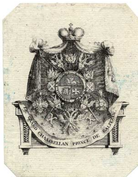
Ил. 12. Эклибрис князя А.М. Голицына (1723–1807). Начало XIX в. Офорт. 100x79, 76x67. Коллекция П.Д. Эттингера из собрания ГМИИ им. А.С. Пушкина. Инв. № ГЭ-6365.

сать этот книжный знак князю Михаилу Петровичу Голицыну (1764–после 1836) согласно статье об эрмитажной части библиотеки Голицынского музея, и Александра Михайловича Голицына (1723–1807), секретаря посольства в Голландии, посланника в Париже и Лондоне, затем вице-президента Иностранной коллегии и вице-канцлера 30 (ил. 12). Пожалуй, для атрибуции появление орденских лент с крестами и ключами (например, камергерскими) отмечает какие-либо вопросы, связанные с отождествлением регалий владельца и его книжного знака. О несомненном преимуществе подобных экслибрисов пишут многие, но подроб-