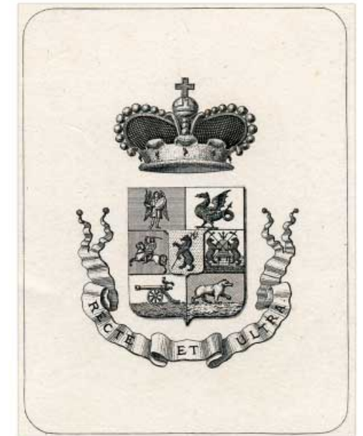
Ил. 3. Эклибрис князя А.Ф. Голицына-Прозоровского (1810–1898). После 1854 г. Офорт, резец. 146x115, размер доски 135x105, 69x52. Коллекция П.Д. Эттингера из собрания ГМИИ им. А.С. Пушкина. Инв. № ГЭ-6370.

зоровских и князей Голицыных». 9 Мы видим, что в первой верхней части щита расположена эмблема Киевского княжества из герба Прозоровских (ОГ I, 11). Видимо, получение двойной фамилии в 1854 г. сыграло определённую роль и в соблюдении традиционной формы щита в гербе, который запечатлён на эклибрисе. Эта форма щита использовалась для составления ОГ во всех без исключения гербах с I по IX том. Том X не мог нарушить установленный порядок в предыдущих девяти томах и поэтому последний печатный том ОГ остался без каких-либо признаков немецкого влияния. Однако в герботворчестве 30–50-х гг. XIX века обнаруживается ориентация на