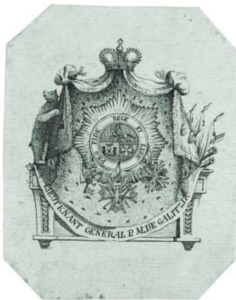
Ил. 11. Эклибрис князя М.М. Голицына (1731–1806). Вторая половина XVIII в. Офорт. 105x83, 76x71. Коллекция У.Г. Иваска из собрания ГМИИ им. А.С. Пушкина. Инв. № ГЭ-2702.