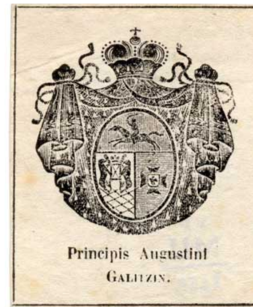
Ил. 9. Эклибрис князя А.П. Голицына (1824–1875). Середина XIX в. Литография. 50х41, 49х40. Коллекция У.Г. Иваска из собрания ГМИИ им. А.С. Пушкина. Инв. № ГЭ-2699.