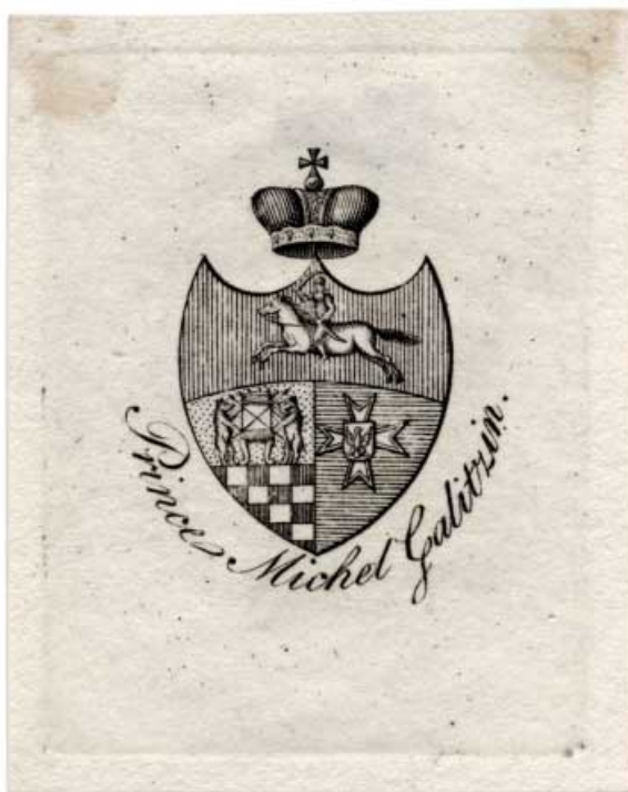
Ил. 6. Экслибрис князя М.Н. Голицына (1796–1863). Вторая четверть XIX в. Офорт. 54x40, 35x29. Коллекция Е.Н. Минаева из собрания ГМИИ им. А.С. Пушкина. Инв. № ГЭ-15547.