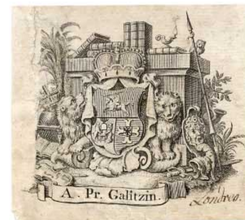
Ил. 8. Экслибрис князя А.М. Голицына (1772–1821). Конец XVIII – начало XIX в. Офорт, резец. 71x78, 63x73. Коллекция У.Г. Иваска из собрания ГМИИ им. А.С. Пушкина. Инв. № ГЭ-2704.

риод поиска и становления геральдических основ в России под влиянием европейских вкусов, которые вдохновляли на дальнейшее использование, например, итальянской формы щита в экслибрисах середины XIX в. Таковым считают экслибрис князя Александра Михайловича Голицына (1772–1821), «...тайного советника, гофмейстера двора вел. кн. Елизаветы Алексеевны и вел. кн. Екатерины Павловны» 23 (ил. 8). В связи с необычной для геральдических канонов композицией герба на этом экслибрисе появились различные версии в атрибуции этого книжного знака в нескольких изданиях по книжному знаку. У. Г. Иваск приписывает его совершенно другому князю – Александру Михайловичу Голицыну (1723–1807) 24 , далее этот экслибрис попадает в поле зрения геральдистов