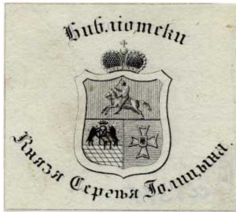
Ил. 4. Экслибрис князя С.М. Голицына (1774–1859). Вторая четверть XIX в. Офорт. 45x50 (обрезан по краю рамки оттиска). Коллекция П.Д. Эттингера из собрания ГМИИ им. А.С. Пушкина. Инв. № ГЭ-6375.

с новым рисунком намёта, более закруглённым и менее типичным для аканта. 10 Содержание эмблем стало беднее при почти полном отсутствии геральдических фигур. 11 В случае с княжескими гербами мы не будем подробно останавливаться на намёте и форме аканта, так как щит располагался на мантии и не нуждался в дополнительном обрамлении. А относительно геральдических и негеральдических фигур следует заметить, что разница между ними состоит в предметности и беспредметности. Геральдическими называют геометрические фигуры, составляющие часть щита или находящиеся в его поле, такие, как «столб», «пояс», «перевязь» и т.д., особое место занимает «крест»; негераль-