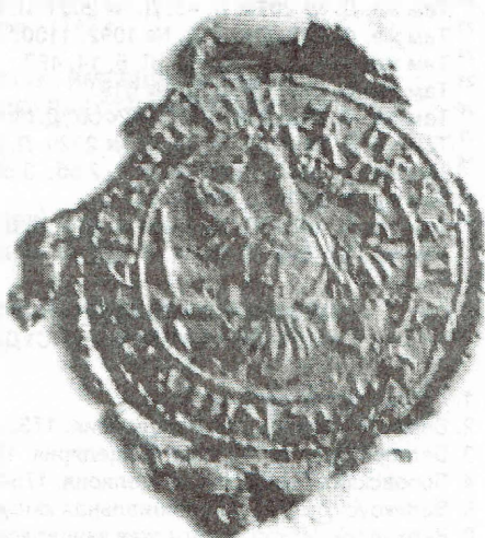
Печать Вятской провинциальной канцелярии 1733 г.