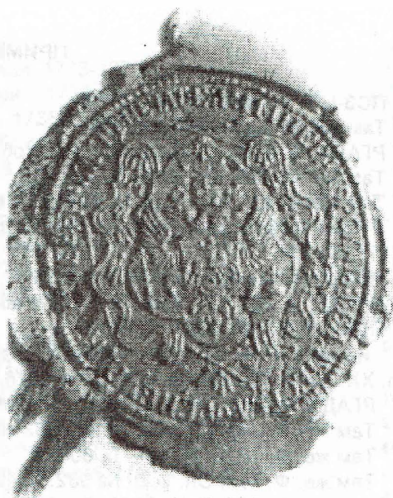
Печать Оренбургской губернской канцелярии 1766 г.