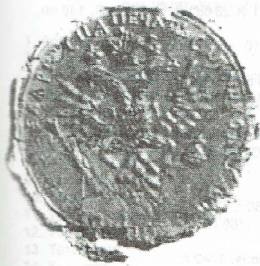
Печать Сапожковской воеводской канцелярии 1777 г.