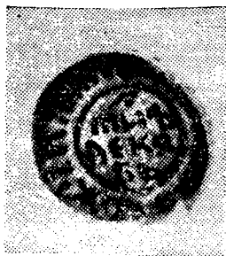
Месячная печать та- можни Белоозера.

(ЦГАДА, ф. 2600, оп. 1, д. № 438, л. 50).