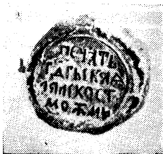
Печать Ляльской та- можни. 1740—1741 гг.

1740—1741 гг. (ЦГАДА, ф. 1600, оп. 1, д. № 17, л. 3);