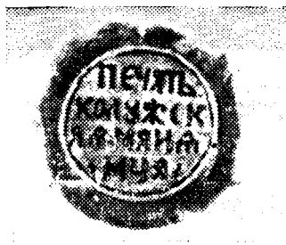
Месячная печать Ка- лужской таможи.