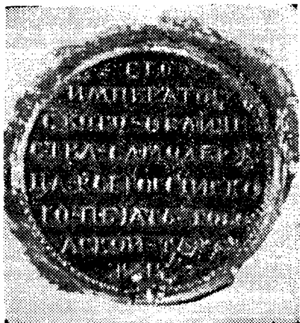
Печать Тобольской таможи. 1740—1741, гг. (ЦГАДА, ф. 2600, оп. 1, д. № 642, л. 8).