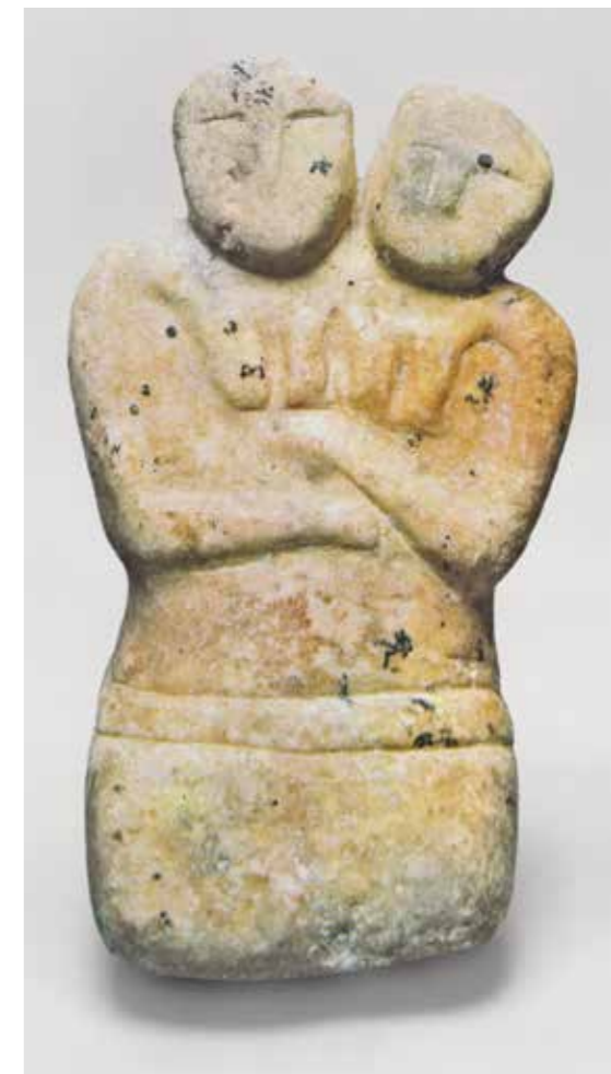
Ил. 4. Двуглавое божество. Чатал-Хююк, Турция. 6-е тыс. до н. э. Воспр. по: The Museum of Anatolian Civilizations. The Guide Book. P. 30. Fig. 28

В конце VIII века до н. э. новохеттские царства были завоеваны Ассирией и исчезли с исторической арены. Памятники последующих веков практически неизвестны, однако появление двуглавого орла в искусстве образовавшегося в Малой Азии византийского государства вряд ли могло