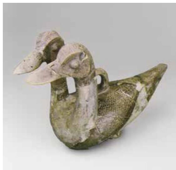
Ил. 6. Сосуд в форме двуглавой утки. Богазкей, Турция. Середина 2-го тыс. до н. э.

быть случайностью. Уже из Византии этот образ перелетел к Сасанидам, для которых, несмотря на постоянное военное и политическое противостояние с Византией, был характерен интенсивный культурный обмен с нею, а со временем и в Россию, где он нашел самое яркое в своей истории воплощение.