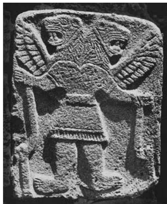
Ил. 8. Плита с рельефом, изображающим двуглавого человека-льва. Тель-Халаф. IX в. до н. э. Музей Передней Азии, Берлин. Воспр. по: Oppenheim M. F. von. Der Tell Halaf. Eine neue Kultur im ältesten Mesopotamien. Leipzig, 1931. Taf. 33a