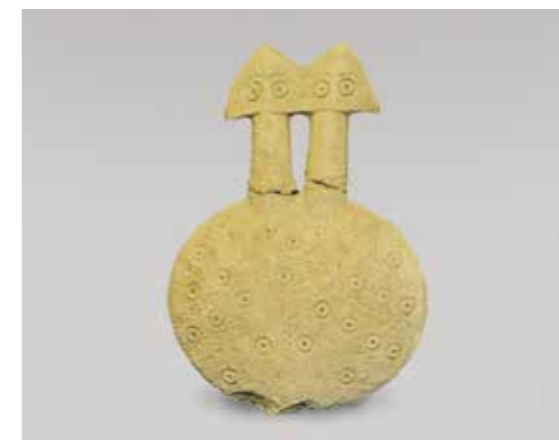
Ил. 5. Двуглавый идол. Каппадокия, Турция. Начало 3-го тыс. до н. э. Воспр. по: The Museum of Anatolian Civilizations. The Guide Book. P. 87. Fig. 121