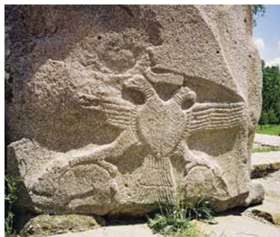
Ил. 1. Изображение двуглавого орла на Вратах сфинксов. Аладжа-Хююк, Турция. XIII в. до н. э.