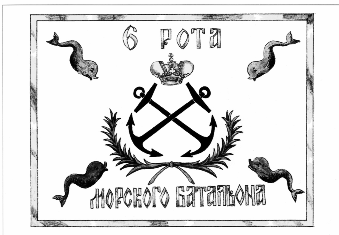
Рис. 3. Фурьерский значок 6-й роты морского батальона 1775–1778 гг.