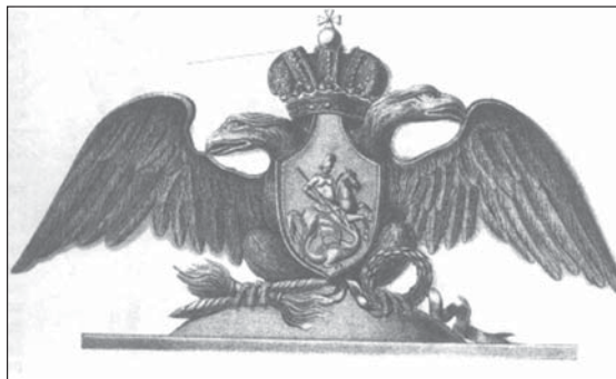
Герб для гвардейского кивера Россия, 1808 г.

В Россию геральдика пришла из Западной Европы в XVII—XVIII вв., хотя первый государственный герб возник ещё в XV столетии. Что касается родовых гербов, то их появление в России относится к XVII веку, и принесли их с собой «выходцы» из Западной Европы, число которых особенно стремительно росло при Петре I. Он пожаловал гербы и своим ближайшим сподвижникам. В 1712 году создаётся знаменитый гербовник с рисунками эмблем, которые следовало помещать на знамёнах полков, расквартированных по городам страны. Ряд таких эмблем стали затем городскими гербами. В 1722 году в Санкт-Петербурге