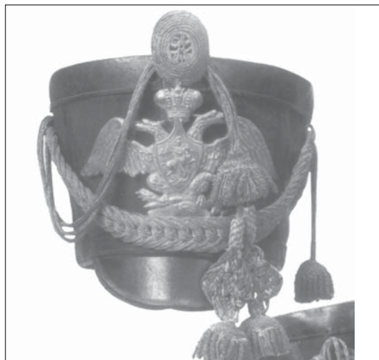
Офицерский кивер с гербом Россия, начало XIX в.

Помимо щита гербы состоят из нескольких элементов, так или иначе связанных с рыцарством: шлемы, разорванный в боях плащ и т.п.