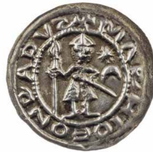
Ил. 3. Брактеат Конрада I Великого. Монетный двор Майсен. Инв. № ОН-3-Г-89729. Государственный Эрмитаж