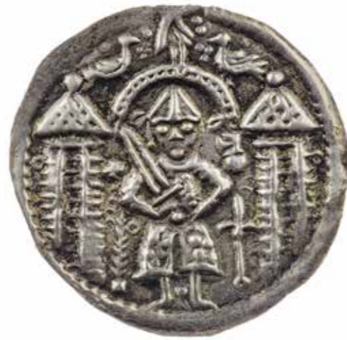
Ил. 2. Брактеат Конрада I Великого. Монетный двор Майсен. Инв. № ОН-3-46835. Государственный Эрмитаж