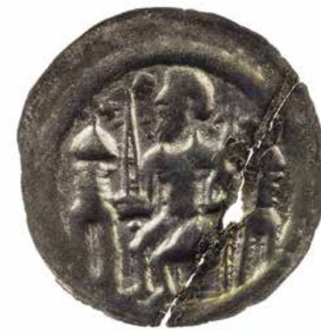
Ил. 10. Брактеат Яксы, князя Кёпника. Инв. № ОН-3-38339. Государственный Эрмитаж

атрибутами: пальмовой ветвью и крестом, или же с лилией в правой руке, экземпляр данной монеты имеется в собрании Эрмитажа (ил. 7) 15 .