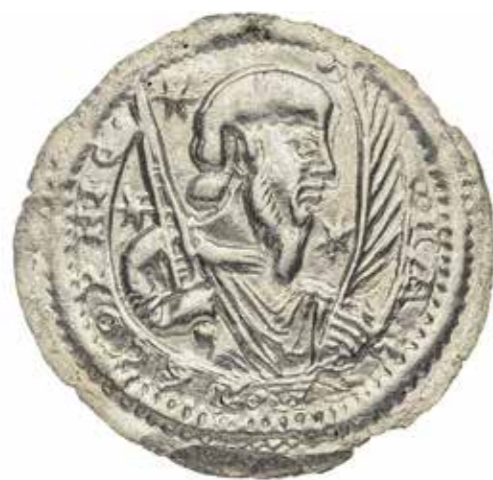
Ил. 11. Брактеат Яксы, князя Кёпника. Инв. № ОН-3-38337. Государственный Эрмитаж

славянского князя. На брактеате помещено великолепное погрудное в профиль (вправо) изображение князя с длинными волосами и бородой, с мечом в правой и пальмовой ветвью в левой руке, в поле изображение трех звезд. По кругу надпись IACZA DE COPNIC. По стилистике изображение не имеет аналогий среди других немецких брактеатов, время его создания скорее всего относится к 60-м годам XII века – периоду, когда Якса уже проиграл войну за Бранденбург.