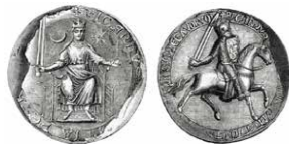
Ил. 6. Прорисовка печати Ричарда Львиное Сердце (1189–1199).