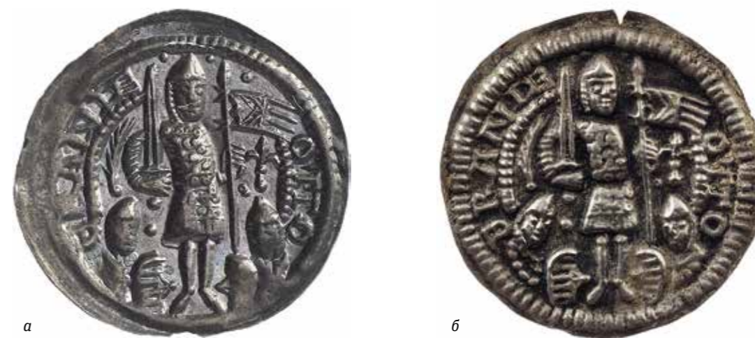
Ил. 12. Брактеат Оттона I: а – оригинал. Государственные Музеи Берлина; б – подделка Николауса Зеелендера (?). Инв. № ОН-3-38356. Государственный Эрмитаж

Один из инициаторов и главных бенефициаров крестовых походов против славян, Генрих Лев, в 1172 году совершил паломничество в Иерусалим, отраженное в письменных источниках 31 . В паломничестве его сопровождали более 1500 персон: епископы, аббаты, графы и простые рыцари. Нельзя исключать, что Генрих Лев намеревался превратить свое паломничество в настоящий крестовый поход, но король Иерусалима и тамплиеры отговорили его от этих намерений. Среди многочисленных брауншвейгских брактеатов Генриха имеется единственный монетный тип, где традиционная фигура льва сопровождается изображением лапчатого крестика в поле монеты. В немецких нумизматических работах нередко можно встретить датировку этой монеты 1172 годом под знаком вопроса 32 .