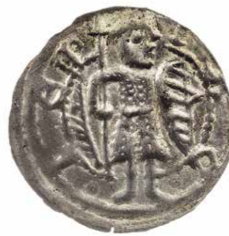
Ил. 9. Брактеат Яксы, князя Кёпника (в Бранденбурге 1153–1157). Инв. № ОН-3-38338. Государственный Эрмитаж