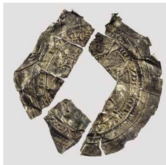
Ил. 14. Брактеат ландграфа Тюрингии Людвиг III. Инв. № ОН-3-К-Пермь-5. Государственный Эрмитаж

располагается сложная геометрическая фигура в виде прямоугольника с лилиеобразными концами (ил. 14) 35 . К сожалению, у монеты вырезана центральная часть, зато хорошо читается часть круговой легенды LVDEVVIGVS ...NCIA...INIA, содержащая имя и титул ландграфа PROVINCIALIS