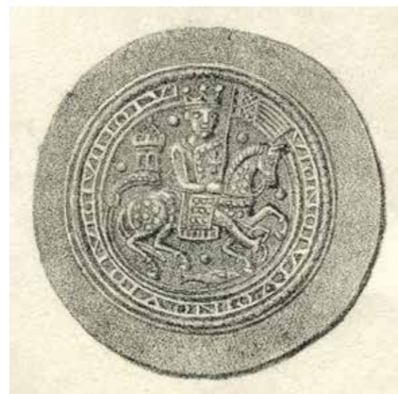
Ил. 16. Прорисовка брактеата Генриха VI (1191–1197). Воспроизводится по: Posern-Klett C. F. von. Sachsens Münzen im Mittelalter. Münzstätten und Münzen der Städte und geistlichen Stifter Sachsens im Mittelalter. Leipzig, 1846. Tfl. I. N 9

хождение монеты неизвестно. Превосходная сохранность не позволяет однозначно утверждать о ее принадлежности к Хотинскому кладу, хотя полная неизвестность в немецкой нумизматической литературе и наличие в хранящейся отдельно эрмитажной части Хотинского клада половинки брактеата с похожим изображением 37 дают повод предполагать именно этот источник поступления.