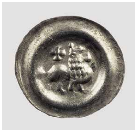
Ил. 19. Брактеат императора Оттона IV. Монетный двор Люнебург. Выпуск 1209–1211 (?). Инв. № ОН-3-96011. Государственный Эрмитаж