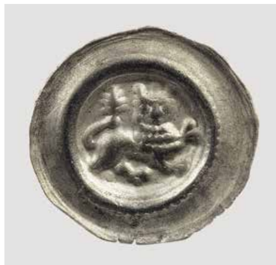
Ил. 20. Брактеат императора Оттона IV. Монетный двор Люнебург. Выпуск 1209–1211 (?). Инв. № ОН-3-95995. Государственный Эрмитаж

фенами 43 . На двух люнебургских брактеатах Оттона IV (1195–1218) небольшого диаметра наряду с изображением коронованного льва присутствует изображение лапчатого креста 44 (ил. 19). На нескольких люнебургских брактеатах Оттона встречается оригинальный сюжет 45 , где идущий вправо коронованный лев держит в кончике хвоста пальмовую ветвь (ил. 20).