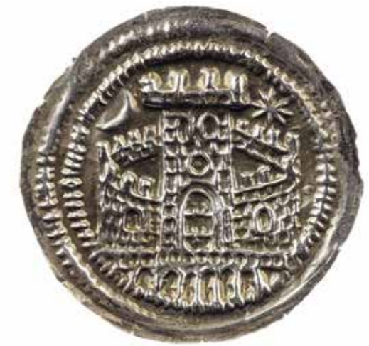
Ил. 4. Брактеат Конрада I Великого. Монетный двор Майсен. Инв. № ОН-3-Г-89718. Государственный Эрмитаж