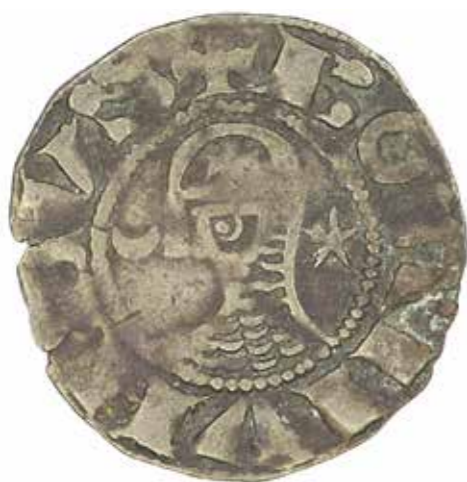
Ил. 5. Деньё Бозмунда III (1149–1163). Антиохия, княжество. Инв. № ОН-3-100451. Государственный Эрмитаж