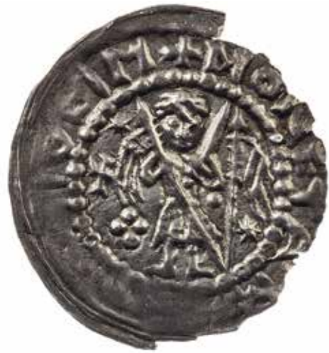
Ил. 1. Ранний брактеат Конрада I Великого (маркграф Майсена в 1123–1156, маркграф Нидерлаузица в 1136–1156). Инв. № ОН-3-Г-91337. Государственный Эрмитаж