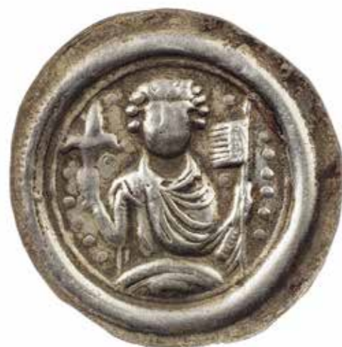
Ил. 7. Брактеат Альбрехта Медведя (1123–1170). Инв. № ОН-3-38344. Государственный Эрмитаж

феодалов, соотнеся их с важными для нашей темы фактами из биографий данных персон.