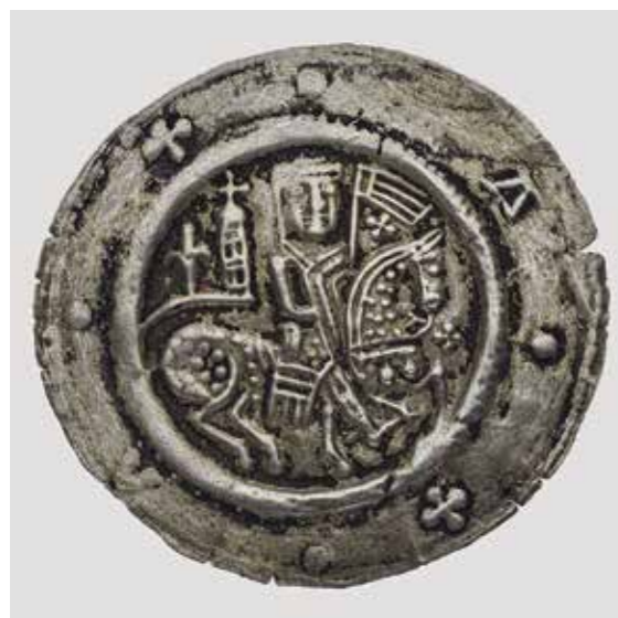
Ил. 15. Чекан ландграфов Тюрингии в Гессене, монетный двор Кассель (?). 1220-е (?). Инв. № ОН-3-107576. Государственный Эрмитаж