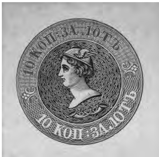
Ил. 2. Эссе почтовой марки. Голова Меркурия. Художник Я. Рейхель, гравёр А. Кирхнер. Центральный музей связи имени А. С. Попова. Инв. № ГКП-37928

В России почтовый рожок как символический отличительный знак почтовой связи также имеет давнюю историю. Афанасий Лаврентьевич Ордин-Нащокин, государственный деятель, которому принадлежит большая заслуга в организации и развитии отечественной почты, разработал и ввел в сентябре 1668 года форму для почтарей 15 , в которой на темно-зеленом кафтане справа нашивался двуглавый орел, слева – почтовый