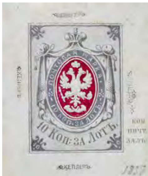
Ил. 4. Проект рисунка почтовой марки. Герб Почтового департамента. Художник Ф. Кеплер. Центральный музей связи имени А. С. Попова. Инв. № ГКП-67388