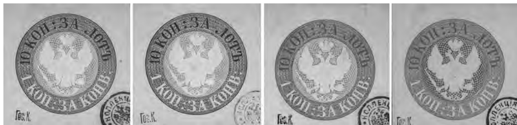
Ил. 1. Эссе почтовых марок. Герб Почтового департамента.

Художник Я. Рейхель, гравер А. Кирхнер. Центральный музей связи имени А. С. Попова. Инв. № ГКП-37929, ГКП-37930, ГКП-37931, ГКП-37932