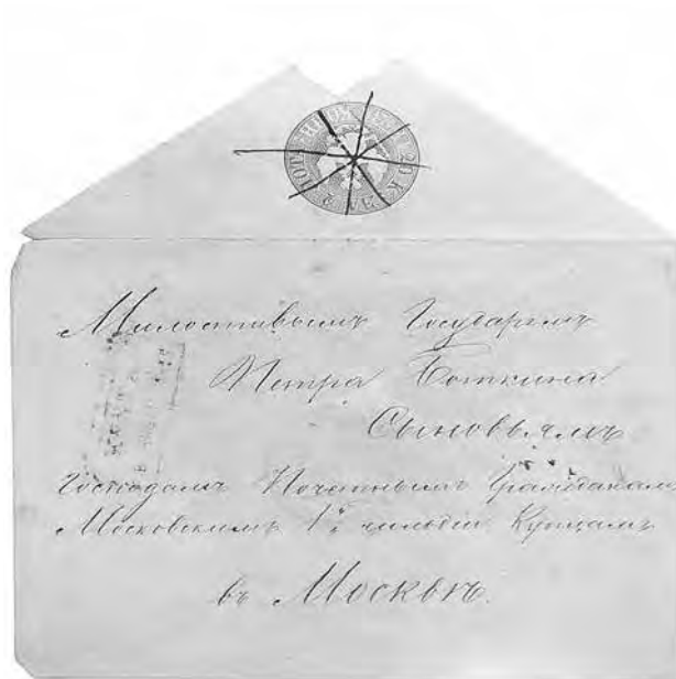
Ил. 6. Штемпельный конверт общегосударственной почты. Инв. № ГКП-36113. Центральный музей связи имени А. С. Попова