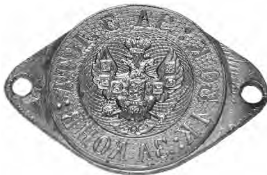
Ил. 7. Штемпель для печатания конвертов общегосударственной почты первого выпуска с «широким» хвостом орла. Инв. № ГКП-100244. Центральный музей связи имени А. С. Попова

Повышенное внимание к мерам, препятствующим нанесению материального ущерба для казны, с одной стороны, позволяет предположить, что гравировка элементов