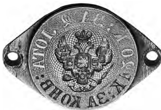
Ил. 8. Штемпель для печатания конвертов общегосударственной почты с «узким» хвостом орла. Инв. № ГКП-100228. Центральный музей связи имени А. С. Попова