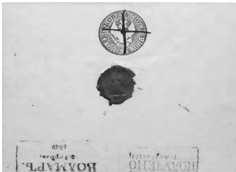
Ил. 2. Штемпельный конверт общегосударственной почты. Инв. № ГКП-36109. Центральный музей связи имени А. С. Попова