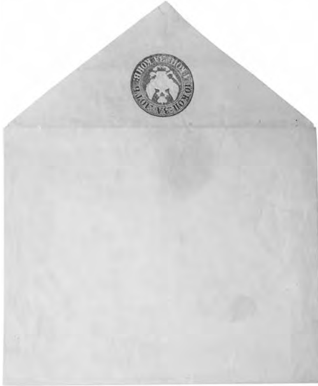
Ил. 5. Штемпельный конверт общегосударственной почты. Инв. № ГКП-36108. Центральный музей связи имени А. С. Попова