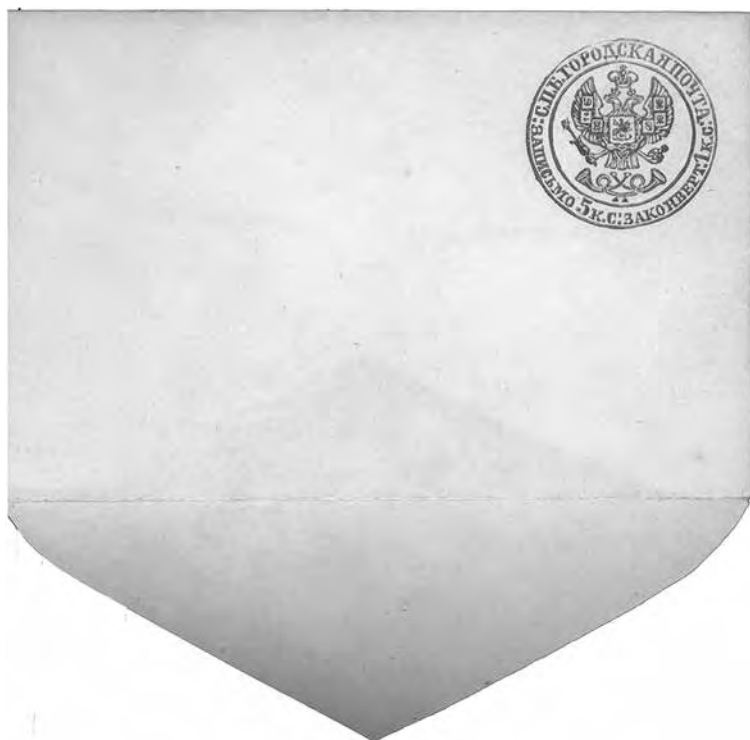
Ил. 1. Штемпельный конверт для городской почты Санкт-Петербурга. Инв. № ГКП-36105. Центральный музей связи имени А. С. Попова