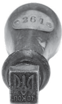
Ил. 1. Штамп ручной каучуковый с трезубцем и номиналом «10 к.» для однократного надпечатывания почтовых карточек Российской империи и Временного правительства. Инв. № ГКП-100358.