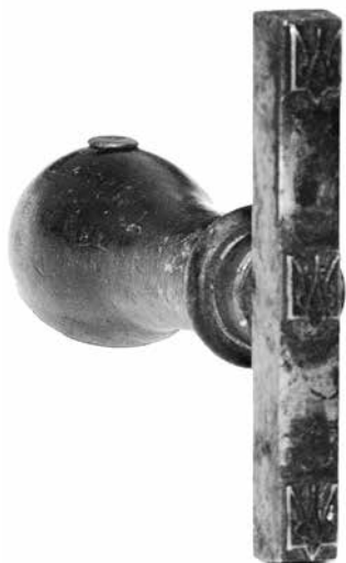
Ил. 3. Штамп ручной металлический с трезубцем для трехкратного вертикального надпечатывания почтовых марок Российской империи 1909–1917 годов. Инв. № ГКП-100351.