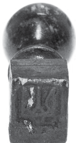
Ил. 6. Штамп ручной каучуковый с трезубцем для однократного надпечатывания почтовых марок Российской империи 1909–1917 годов. Инв. № ГКП-100363.