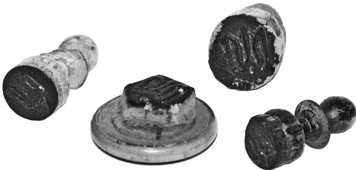
Ил. 5. Штампы ручные с трезубцами для надпечатывания почтовых марок Российской империи 1909–1917 годов. Инв. № ГКП-100364, ГКП-100367, ГКП-100365, ГКП-100368.

собственными силами, но не вполне ясна ситуация с легальностью этих марок. Тем не менее случаев, «чтобы оплата какого-либо почтового отправления марками реального местного выпуска не была засчитана» 17 , не зафиксировано.