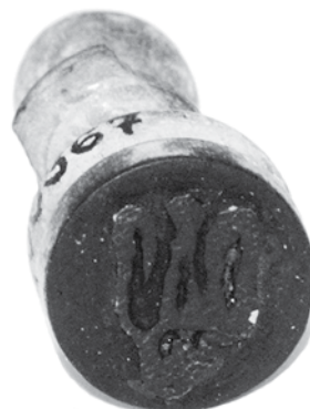
Ил. 7. Штамп ручной каучуковый с трезубцем для однократного надпечатывания почтовых марок Российской империи 1909–1917 годов. Инв. № ГКП-100367.