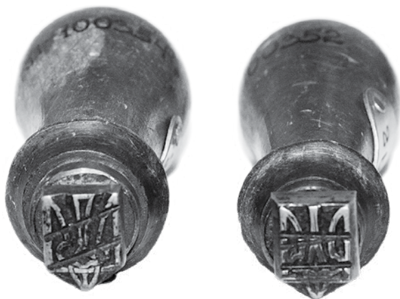
Ил. 2. Штампы ручные металлические с трезубцами для однократного надпечатывания почтовых марок Российской империи 1909–1917 годов. Инв. № ГКП-100352, ГКП-100354.

местах. Во время штемпелевания марок почтовые открытки штемпелевать только в границах действительной необходимости. № 2095» 9 .