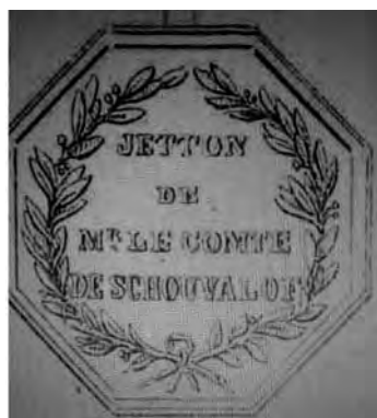
Ил. 4 а, б. Жетон, посвященный графу П.И. Шувалову. Авт. Ж.-А. Дасье, 1756–1758 гг. Лицевая и оборотная стороны (Иверсен Ю.Б. Медали в честь русских государственных деятелей и частных лиц. Т. 2. СПб., 1883. С. 351–352. Табл. L, № 4).

его владелец возведен в графское достоинство Российской империи. Выбор в пользу этого, первого по счету и важности, нашламника в данном случае вполне понятен.