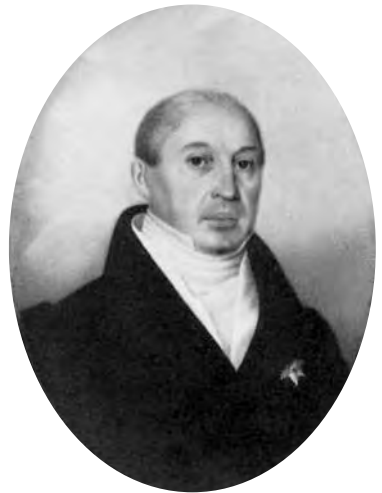
Ил. 1. Василий Романович Марченко

После выхода С.С. Жегулина в отставку В.Р. Марченко решил попытать счастья в Петербурге и благодаря поддержке бывшего могилевского губернатора Сергея Кузьмича Вязмитинова в 1799 г. получил место протоколиста Комиссариатской экспедиции Военной коллегии.