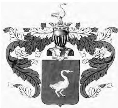
Ил. 3. Герб рода Марченко из «Общего гербовника дворянских родов Всероссийской империи». 1801 г.