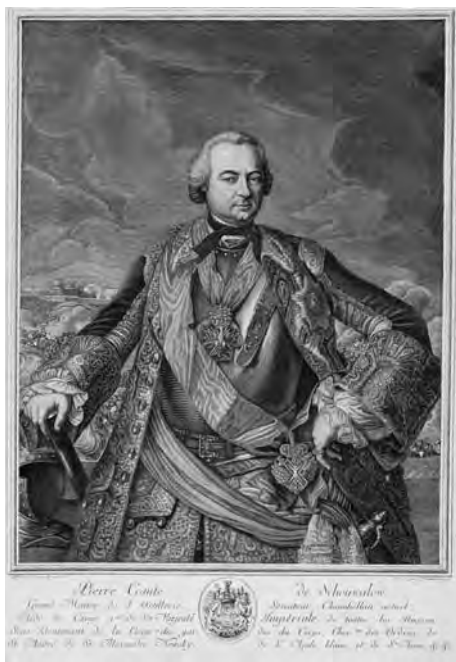
Ил. 2. Портрет графа П.И. Шувалова. Авт. Х.А. Вортман. 1760 г. Инв. ЭРГ-16283. Государственный музей изобразительных искусств им. А.С. Пушкина. Москва. Инв. ГР-95030. Государственный Эрмитаж. Санкт-Петербург.

нявшему свой герб 47 , но на предметах четы Шуваловых его не встречается даже в марьяжном сочетании. Зато фиксируются, как минимум, три варианта изображения герба мужа: полный, почти полностью соответствующий позже утвержденному и сокращенный.