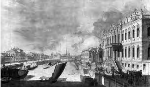
Ил. 7. Вид от Крюкова канала вверх по реке Мойке с изображением дворца П.И. Шувалова. Авт. М.И. Махаев . 1757–1759 гг. (План столичного города Санкт-Петербурга с изображением знатнейших оного проспектов, изданный трудами Императорской академии наук и художеств в Санкт-Петербурге: репринт. изд. 1753 г. СПб., 2007).

продемонстрировать свою причастность к лейб-компани? 68