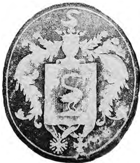
Ил. 2. Печать В.Р. Марченко. 1812 г. Государственный архив Алтайского края. Ф. 1. Оп. 2. Д. 459. Т. 4. Л. 531. Публикуется впервые.

Герб на печати совпадает с описанием из «Общего гербовника», а имеющаяся шраффировка поля щита подтверждает, что он красного цвета. Лебедь на щите и над короной не имеет никакой шраффировки, что также свидетельствует в пользу того, что они серебряные.