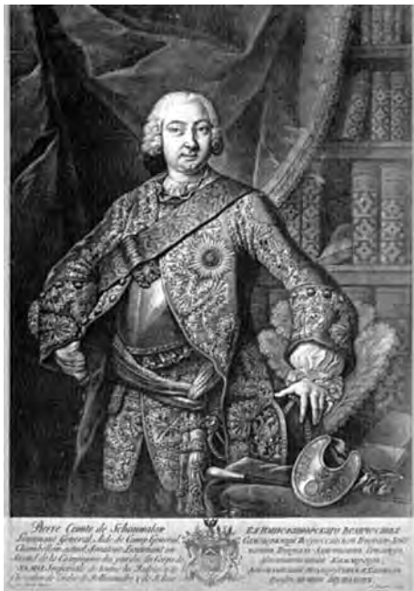
Ил. 1. Портрет графа П.И. Шувалова. Авт. И. Штенглин. Между 1748 и 1752 гг. Инв. ЭРГ-16284. Государственный Эрмитаж. Санкт-Петербург.

Графиня Мавра Егоровна Шувалова по рождению принадлежала к старинному дворянскому роду Шепелевых 46 , в середине XVIII в. уже приме-