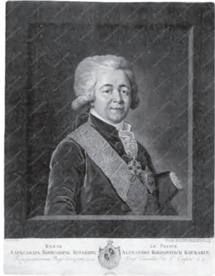
Рис. 7. Портрет князя А.Б. Куракина Младшего. 1796 г. По оригиналу Ж.-Л. Вуаля. Инв. № ГР-0853. Государственный музей изобразительных искусств имени А.С. Пушкина. Москва.

1717 г. новгородский герб изображен в черном поле, тоже – на печати князя А.Б. Куракина Младшего 1770-х гг., на его портретах (1779, 1796, 1812 гг. и двух – 1800-х гг.) и видах усадьбы Надеждино 1796–1797 гг., а также на упомянутом суперэкслибрисе и печати его брата Степана Борисовича. Как