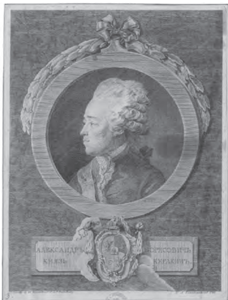
Рис. 6. Портрет князя А.Б. Куракина Младшего. 1779 г. Авт. А.Я. Колпашников. По оригиналу Ж.-Л. Де Вели. Инв. № ГР–0852. Государственный музей изобразительных искусств имени А.С. Пушкина.

(как в «Общем гербовнике») 17 . На других она усечена до стула с помещенными на нем двумя скрещенными жезлами. Это отличие может быть связано с большим размером бляхи по сравнению с табакеркой и печатью 18 .