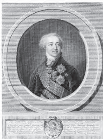
Рис. 9. Портрет князя А.Б. Куракина Младшего. Авт. И.С. Клаубер, по оригиналу В.Л. Боровиковского. 1800-е гг. Инв. № ГР–8059. Государственный музей изобразительных искусств имени А.С. Пушкина. Москва.

видим, различия в практическом цветовом оформлении герба сохранялись и в начале XIX в., после внесения герба в «Общий гербовник».