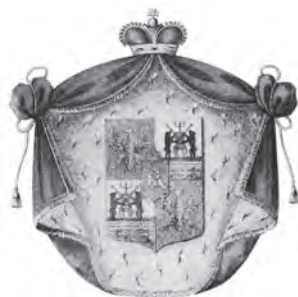
Рис. 4. Герб князей Хованских («Общий гербовник дворянских родов Всероссийской империи»). 1799 г.

Попытки идентифицировать хозяина геральдической бляхи из Тверского музея (или хотя бы очертить круг возможных претендентов) объединили материал, демонстрирующий некоторые особенности иконографического бытования герба князей Куракиных в XVIII–XIX вв.