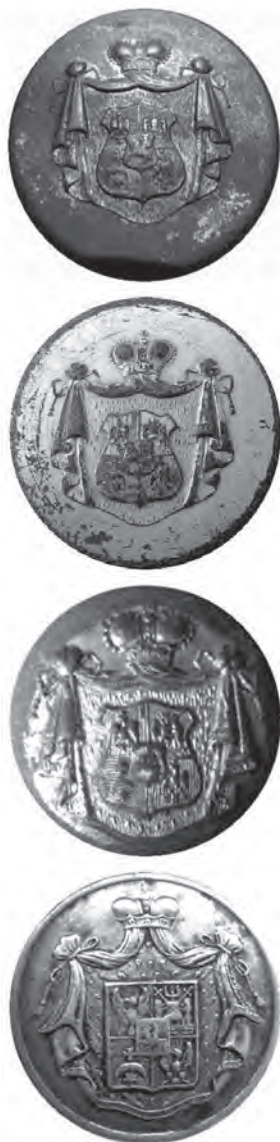
Рис. 11. Пуговицы с гербом князей Куракиных. Вторая половина XIX в.