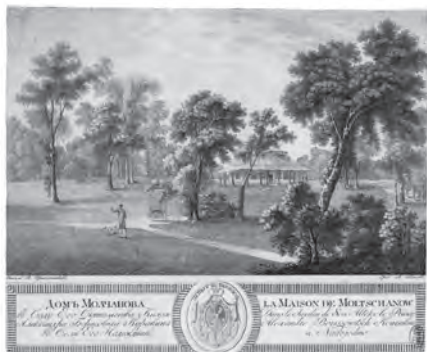
Рис. 8. Дом Молчанова в усадьбе А.Б. Куракина Надеждино. Авт. В.И. Иванов (Семенов), по оригиналу В.П. Причетникова. 1799–1800 гг. Инв. № ГР–50550. Государственный музей изобразительных искусств имени А.С. Пушкина. Москва.