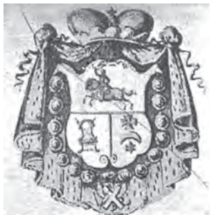
Рис. 3. Печать с табакерки князя Александра Борисовича Куракина Старшего. 1740-е гг.