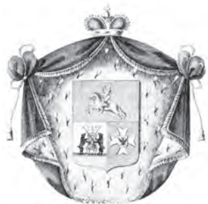
Рис. 5. Герб князей Голицыных («Общий гербовник дворянских родов Всероссийской империи»). 1799 г.

Герб на бляхе из Тверского государственного объединенного музея отличается от двух других известных изображений трехчастного герба князей Куракиных полной прорисовкой новгородской эмблемы во второй части