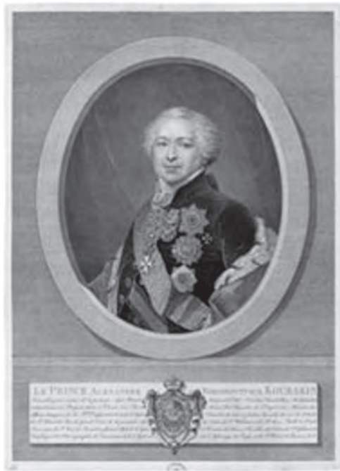
Рис. 10. Портрет князя А.Б. Куракина Младшего. Авт. Н.И. Уткин, по оригиналу Ж.-Б. Реньо. 1812 г. Инв. № ГР-8061. Государственный музей изобразительных искусств имени А.С. Пушкина. Москва.