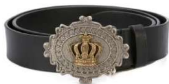
Рисунок 6. Пряжка Dolce & Gabbana Figure 6. Belt buckle by Dolce & Gabbana

Неотъемлемая часть мужского гардероба – это ремень с красивой пряжкой. Пряжка – это застёжка, прикрепленная к одному из концов и предназначенная для соединения двух концов ремня вместе. Первые пряжки появились много веков назад и предназначались для подпоясывания одежды, ношения оружия. Изготавливались они преимущественно из костей или дерева. Позднее пряжки появились из бронзы, серебра и других металлов, которые были богато украшены драгоценными камнями. Подобные элементы гардероба указывали на благородное происхождения человека. В 21 веке функционал пряжек усовершенствован, а также разработано множество вариаций застёжек (рисунк 6-7).