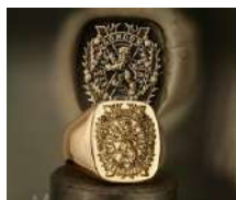
Рисунок 1. Кольцо-печатка by Dexter Figure 1. Signet Rings by Dexter

настоящее время кольцо-печатка не несет в себе значения величия, но подчеркивает статус владельца, особенно, если ювелирное украшение передается по наследству [4]. В известных ювелирных домах не раз появлялись коллекции с геральдическими символами. К ним относятся – Dolce & Gabbana, Stephen Websrer, Gucci, Coro, Jomaz., ART, 1928 Jewelry, Signet Rings by Dexter (рисунки 1-2).