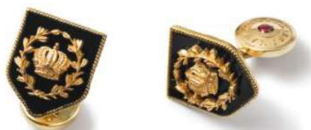
Рисунок 5. Запонки Dolce & Gabbana Figure 5. Cufflinks by Dolce & Gabbana

облегчали закрывание запонки. Простые цепи, которые использовались в прошлом, заменены стержнями. Данный вид мужского аксессуара служит атрибутом не только на торжественные встречи, но и как дополнение образа в обычной жизни. На сегодняшний момент существует десятки видов застёжек с уникальным дизайном, например как у Dolce & Gabbana (рисунк 5).