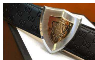
Рисунок 7. Пряжка Gucci Figure 7. Belt buckle by Gucci

Обсуждение результатов. В представленных примерах было исследовано использование геральдических элементов в мужских ювелирных украшениях. Исходя из собранной информации, обращая особое внимание на аналоги и изученную символику, были разработаны следующие изделия, представленные ниже на рисунке (рисунк 8).