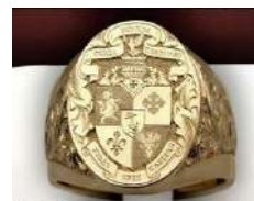
Рисунок 2. Кольцо-печатка by Dexter Figure 2. Signet Rings by Dexter

Другие характерные украшения для мужчин Средневековья являлись пуговицы, значки для шляп, украшения для оружия, броши, браслеты, фибулы, цепочки с подвесками. Брошь представляла собой длинную иглу для скрепления одежды. Броши и фибулы служили на крепления рыцарского плаща, который был исключительно необходимой и незаменимой вещью. Плащ защищал кольчужные доспехи воина во время битвы, а также от палящего солнца, и от ночного холода. Современные броши крепятся на лацкан пиджака в качестве стильного ювелирного украшения.